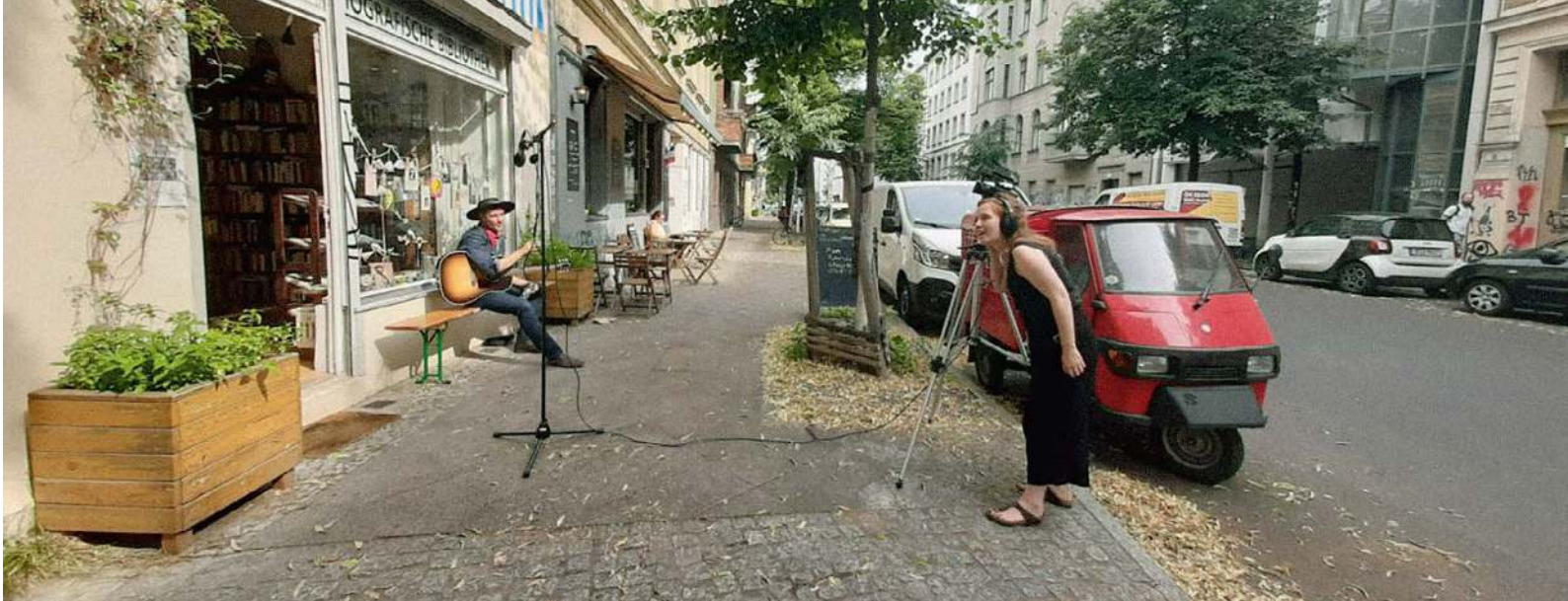
Dreharbeiten „Save the Last Kiez“