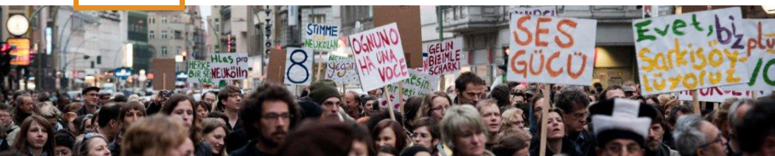
Sounding Neukölln am 16. April 2011 auf der Karl-Marx-Straße

Sehr geehrte Damen und Herren, liebe Freunde der [Aktion! Karl-Marx-Straße],