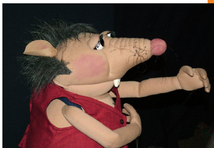
Puppentheater-Museum © Nikolaus Hein