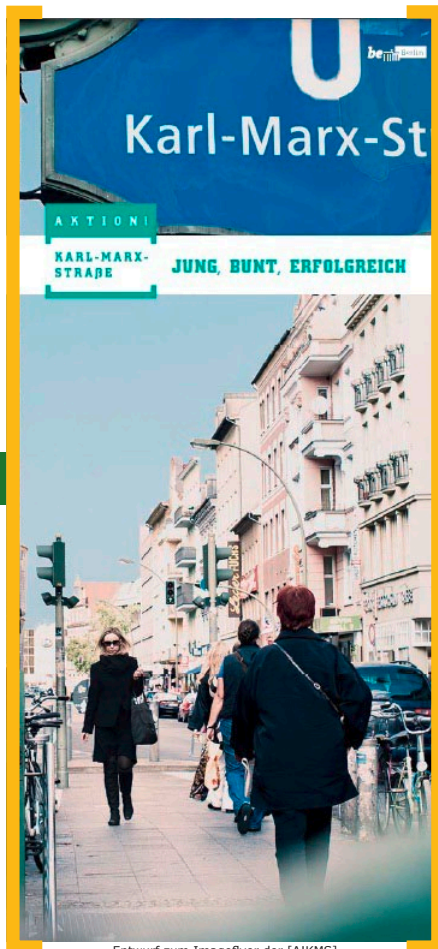
Entwurf zum Imageflyer der [AIKMS] © F+S/eckedesign

Unsere Website www.aktion-kms.de erfreut sich immer größerer Beliebtheit. Nicht nur die Zahl der Besucher steigt, auch die Anfragen, auf unserer Seite präsent zu sein, nimmt immer mehr zu. Daher haben wir uns für Anfang 2012 einen Web-Relaunch vorgenommen, um Ihnen die Fülle an Informationen übersichtlicher präsentieren zu können. Auch der Druck der Seiten soll erleichtert werden und eine ausgeklügelte Farbpalette für visuelle Abwechslung sorgen.