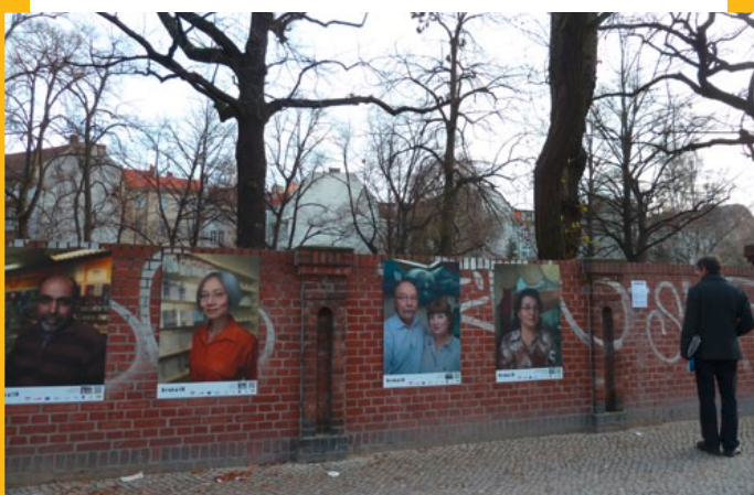
Ausstellung „Wir machen Neukölln“

Wer derzeit die Karl-Marx-Straße entlangläuft wird zwischen Baggern und Bauzäunen durchaus eine Überraschung erleben. So wurde an der Mauer der evangelischen Kirchengemeinde eine Reihe von übergroßen Porträtfotos aufgehängt, die den Blick der Passanten vom Baustellen Geschehen ablenken. Zu sehen sind darauf 12 Betreiber kleiner Kiezläden aus dem Bezirk, die in der Ausstellung ins Rampenlicht gerückt werden. Denn ihnen gebührt Beachtung, schließlich sind es die kleinen Läden um die Ecke, die Neukölln abseits großer Einkaufszentren seinen unverwechselbaren Charakter geben. Sie machen Neukölln. Ausstellung bis 6.1.2012 auf der Karl-Marx-Straße/Ecke Kirchhofstraße.