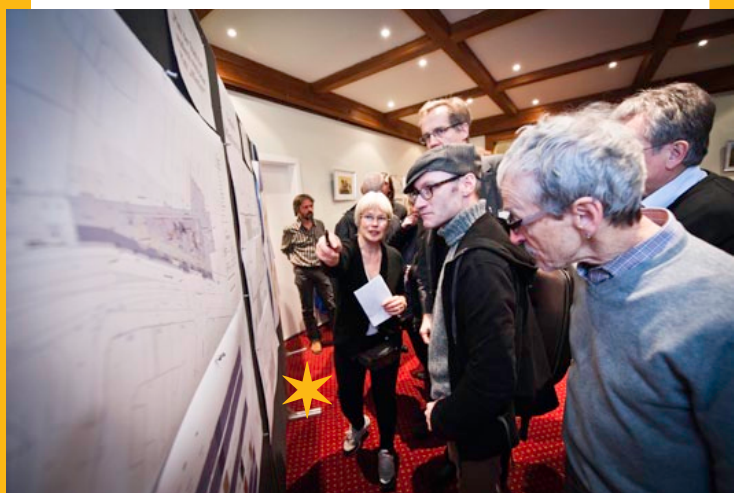
Treffen der [A!KMS] – Marktstand Verkehr/Öffentlicher Raum

An mehreren Marktständen zu den Themen Handel, Verkehr/Öffentlicher Raum, Wohnen und Kultur konnten Wünsche, Fragen und Bedenken direkt mit den Akteuren und Partnern der [A!KMS] ausgetauscht und Ausblicke für 2012 aufgezeigt werden. Kontrovers diskutiert wurde insbesondere das Thema „Wohnen“, da die Bewohner durch Aufwertung steigende Mieten und Verdrängung befürchten. Vertreter des Tiefbauamtes präsentierten zudem die ersten Varianten für einen Umbau der Neckarstraße und fanden viel Zustimmung.