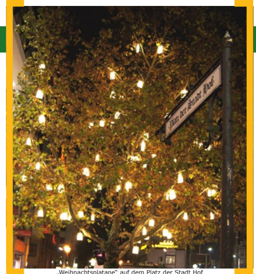
„Weihnachtsplatane“ auf dem Platz der Stadt Hof