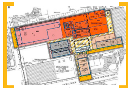
Screenshot B-Plan

Wegen Bauarbeiten ist die Ganghoferstraße seit dem 27. November 2012 gesperrt, wir bitten um Ihr Verständnis.