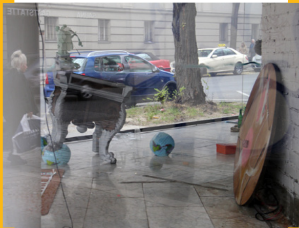
Gaststätte im Schaufenster