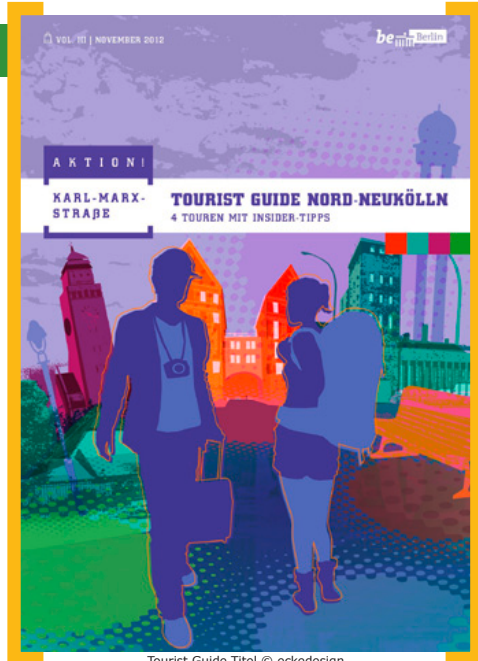
Tourist Guide Titel © eckedesign

Sie können den „Tourist Guide Nord-Neukölln“ auch unter http://www.aktion-kms.de/tourist-guide/ als PDF-Datei herunterladen.