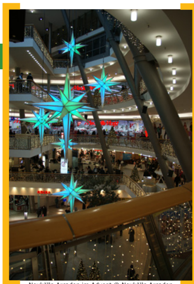
Neukölln Arcaden im Advent

22. Dezember 2013 — Louis Lewandowski-Festival – World Festival of Synagogal Music sowie Weihnachtsmärkte