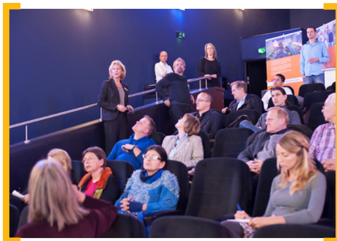
12. Treffen der [Aktion! Karl-Marx-Straße]

2012 war ein ereignisreiches Jahr an der Karl-Marx-Straße: das Jubiläum 275 Jahre Böhmisches Rixdorf wurde mit dem Spatenstich zum Umbau der Richardstraße verbunden, die Events „48 Stunden Neukölln“ und das Ramadanfest lockten im Sommer zahlreiche Gäste auf die Karl-Marx-Straße. Aber auch im Herbst kamen viele Besucher, um bei „Nacht und Nebel“ und dem „Late Light Shopping“ das Bezirkszentrum Neuköllns zu entdecken. Zusammen mit Staatssekretär Gothe und Bezirksbürgermeister Buschkowsky erfolgte außerdem am 17. August der Spatenstich für den Umbau des Platzes der Stadt Hof. Am 26. Oktober wurde der Verkehr für den südlichen Teil der Karl-Marx-Straße/Lahnstraße bis Jonasstraße frei gegeben. Wir möchten uns bei unseren vielen Partnern, den Künstlern, den Gewerbetreibenden, den Sponsoren und nicht zuletzt den Anwohnern sehr herzlich für Ihr Engagement bedanken!