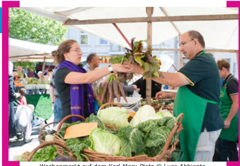
Wochenmarkt auf dem Karl-Marx-Platz

Informationen zum BROADWAY NEUKÖLLN finden Sie unter www.aktion-kms.de/aktiv/redaktion-broadway-neukoelln . Kontakt: Fromlowitz + Schilling, Tel.: 030. 823 09 888, E-Mail: mail@fromlowitz-schilling.de .