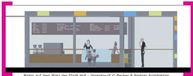
Bistro auf dem Platz der Stadt Hof – Vorentwurf © Becker & Partner Architekten

Der Umbau des Platzes der Stadt Hof läuft auf Hochtouren. Ein Herzstück der neuen Platzgestaltung und -nutzung ist das neue Bistro mit Außengastronomie und Veranstaltungen. Hierfür hat die [Aktion! Karl-Marx-Straße] im Sommer 2012 ein