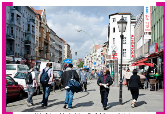
Mehr Grün auf der Karl-Marx-Straße?

+++ Namensvorschläge Platz der Stadt Hof +++ Namensvorschläge Platz der Stadt Hof +++ Namensvorschläge Platz der Stadt Hof +++ Boddinplatz +++ Richard Boulevard +++ Neuköllner Platz +++ Rixdorfer Platz +++ NN-Platz +++ NeuWeltKöllnPlatz +++ Platz der Stadt Hof +++ Platz der Nationen +++ Platz des Stadtteils Neukölln +++ Platz des Weltbürgers +++ Weltbürgerplatz +++ Rixi +++ Mohammed-Bouazizi-Platz +++ Bürger- forum Neukölln +++ Bürgerforum +++ Platz der Stadt Hof „Bürgerforum“ +++ Bürgerforum Neukölln +++ Platz der Internationalen Völkergemeinschaft +++ Neuköllner Platz +++ Bürgerplatz +++ Platz der Vielfalt +++ Bürgersteig +++ Buenos Aires +++ Am Platz +++ Neukölln-Platz +++ Platz da +++