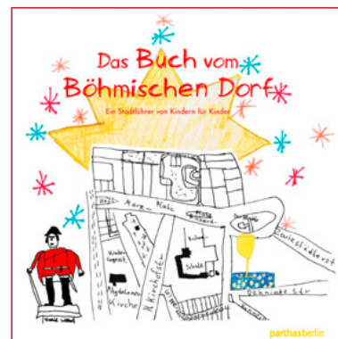
Cover des Buches vom Böhmisches Dorf