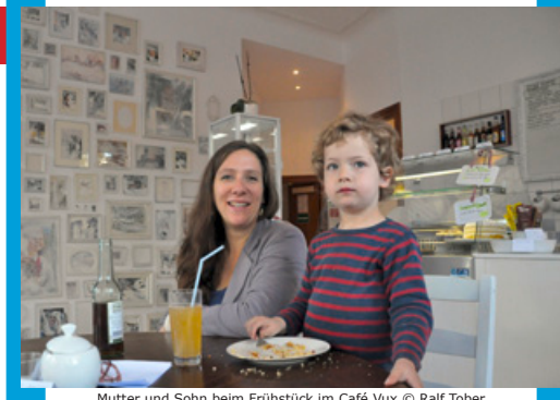
Mutter und Sohn beim Frühstück im Café Vux

Tourist Guide liegt aus: Nachdem es durch technische Probleme bei der Produktion zu einer Verzögerung des Drucks gekommen war, liegt der aufwendig gestaltete Tourist Guide jetzt für Sie bereit. Sie finden unsere Broschüre, die auf vier Touren abseits des Mainstreams durch Nord-Neukölln führt, z.B. im Prospektständer der [Aktion! Karl-Marx-Straße] im Untergeschoss des Saalbaus Neukölln, im NIC – Neukölln Info Center im Haupteingang des Rathauses Neukölln, im Hotel Kari-buni oder im Rixpack Hostel. Die PDF-Variante zum Download steht weiterhin unter → www.aktion-kms.de/tourist-guide/ zur Verfügung.