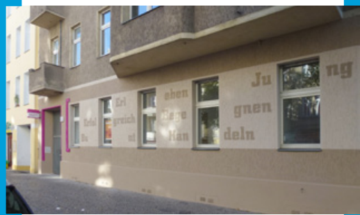
Vor-Ort-Büro der [Aktion! Karl-Marx-Straße]