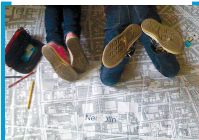
Schülerworkshop 2012 © Kawoka Architekten

Nähere Informationen, die Dokumentation des Arbeitsprozesses und die Ergebnisse aller Workshops finden Sie im Projekt-Blog → www.kms-nk.net . Am 3. Juni 2013 ab 13.00 Uhr findet auf dem Karl-Marx-Platz außerdem eine zentrale Abschlussveranstaltung statt, zu der Sie herzlich eingeladen sind. Nähere Informationen hierzu erhalten Sie im Mai-Newsletter.