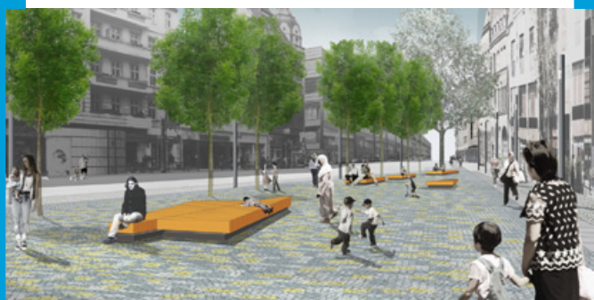
Planung für den Platz der Stadt Hof © el:ch Landschaftsarchitekten

Ende Mai 2013 findet das 13. Treffen der [Aktion! Karl-Marx-Straße] statt. Erfahren Sie alle Neuigkeiten zur Entwicklung der Karl-Marx-Straße aus erster Hand, beteiligen Sie sich am Bürgervotum für das Gutachterverfahren zur Freiraumgestaltung der Karl-Marx-Straße und lassen Sie sich von uns persönlich über die Baustelle am Platz der Stadt Hof führen, auf der es nach dem langen Winter endlich voran geht. Eine separate Einladung zum Treffen der [Aktion! Karl-Marx-Straße] mit Darstellung aller Themen im Einzelnen erhalten Sie im Mai-Newsletter.