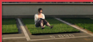
Titel BROADWAY NEUKÖLLN 3

DAS MAGAZIN DER AKTION! KARL-MARX-STRASSE