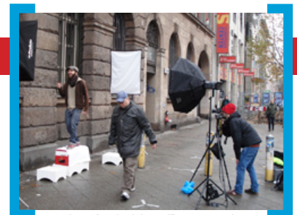
Making of „Behind the Wall“

Bitte denken Sie dran: Unter dem Motto „Aufblühende Karl-Marx-Straße“ legt die [Aktion! Karl-Marx-Straße] zum 7. Mal den Aktionärsfonds auf, in dem Ihre Projekte unterstützt werden, die die Karl-Marx-Straße und ihr Image stärken. Wir freuen uns auf Ihre Bewerbungen und laden Sie herzlich zur Informationsveranstaltung am