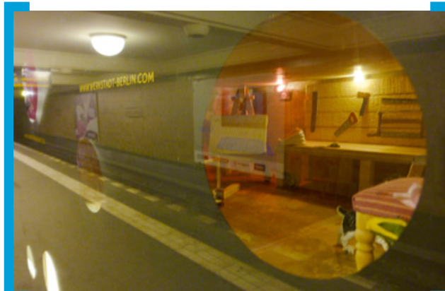
Kreativnetz Neukölln in der Vitrine der [Aktion! Karl-Marx-Straße]

Noch bis zum 10. Mai präsentiert sich das Kreativnetz Neukölln in der Vitrine der [Aktion! Karl-Marx-Straße]. Erstmalig wurde die Vitrine in einen Schaukasten verwandelt, der den Besucher dazu einlädt, einen Blick durch die verschiedenen Gucklöcher zu wagen und dort die gestalterischen Arbeiten und Produkte von zwölf Unternehmen aus dem Kreativnetz zu entdecken. Anschließend stellt sich ab Mitte Mai die Bioase 44 vor, die seit Dezember letzten Jahres das Angebot an der Karl-Marx-Straße bereichert.