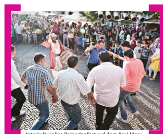
Interkulturelles Ramadanfest auf dem Karl-Marx-Platz 2012

Die arabischen und türkischen Vereine in Neukölln laden alle Berliner herzlich ein, eines der höchsten Feste im arabischen und türkischen Kulturraum gemeinsam zu erleben: das Ramadanfest, mit dem drei Tage lang das Ende der Fastenzeit begangen wird. Auf dem Karl-Marx-Platz werden Einblicke in die Kulturtraditionen unterschiedlicher Länder geboten – mit traditioneller und moderner Musik, Tanz, einem weit gefächerten Angebot kulinarischer Besonderheiten, Kunsthandwerk, Kalligrafie und Henna sowie Clownerie, Spielen und Schminkangeboten für Kinder. Schirmherr ist Frank Henkel, Senator für Inneres und Sport. Veranstaltet vom DAZ – Deutsch-Arabisches Zentrum für Bildung und Integration, unterstützt von der Türkischen Gemeinde zu Berlin, Piranha Kultur und dem Citymanagement der [Aktion! Karl-Marx-Straße].