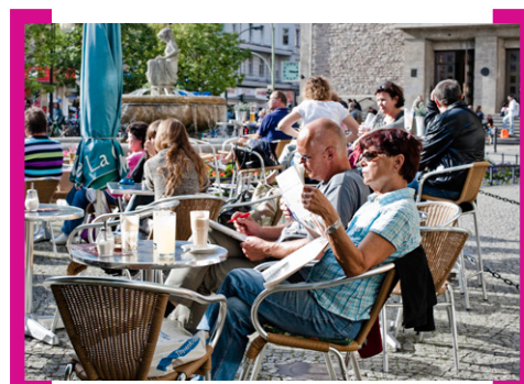
U.a. im aktuellen Handels-Newsletter: Café La Grappa auf dem Rathausvorplatz

Die Storch Apotheke – ganz rund und mit historischer Einrichtung im Jugendstil – befindet sich schon seit 1913 direkt am Platz der Stadt Hof. Am 27. August 2013 feiert sie von 10.00 bis 18.00 Uhr ihren 100. Geburtstag. Kommen Sie vorbei und lassen Sie sich vom Jubiläumsprogramm überraschen. Ort: Ganghoferstr. 1, 12043 Berlin. → www.storchapotheke.de .