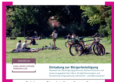
Einladung zur Bürgerbeteiligung Sonnenallee

Das Bezirksamt Neukölln, Fachbereich Stadtplanung, der Prozesssteuerer BSG und das Beteiligungsgremium Sonnenallee laden alle im Sanierungsgebiet Wohnenden und Arbeitenden sowie alle Eigentümer herzlich zur Neuwahl des Beteiligungsgremiums Sonnenallee ein. Ferner möchten wir Ihnen den überarbeiteten Entwurf für die Umgestaltung des Lohmühlen- und Weichselplatzes vorstellen. Kommen Sie am 26. August 2013 um 18.30 Uhr in das Foyer der Quartierssorthalle auf dem Campus Rütli (Rütlistr. 35 - 36, 12045 Berlin) und informieren Sie sich, stellen Sie sich zur Wahl oder entscheiden Sie mit. Weitere Infos → www.kms-sonne.de/sonne .