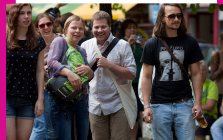
48 Stunden Neukölln 2013

Das Kunstfestival 48 STUNDEN NEUKÖLLN hat sich im 15. Jahr neu erfunden. Überall in Nord-Neukölln war der neue Schriftzug zu lesen: „Hier ist Kunst“. Selbstbewusst und stolz präsentierten die Künstler/-innen aus Neukölln sowie Gäste aus der ganzen Welt ihre künstlerischen Arbeiten. Es beteiligten sich 250 temporäre und bereits etablierte Veranstaltungsorte in Nord-Neukölln mit ca. 400 Veranstaltungen. Das Publikumsinteresse nahm bei idealem Festivalwetter gegenüber den Vorjahren noch einmal zu. Nach ersten Schätzungen kamen mehr als 75.000 Besucher/-innen, um den „Perspektivwechsel!“ (Jahresthema 2013) zu erleben. Besonders die beiden Festivalreihen „Kunst und Kult – Stimmen der Religionen“ und „Labor: Urbanes Altern“ fanden großen Anklang. Im Young Arts NK war ein vielseitiges Programm für Kinder und Jugendliche zu sehen. Hier zeigte die Ausstellung „Ich bin Du“ Arbeiten von Schüler/-innen der Röntgen-, Hans-Fallada- und Ernst-Abbe-Schule. Save the Dates: 48 STUNDEN NEUKÖLLN findet wieder statt vom 27. bis 29. Juni 2014. Vorher, am 2. November 2013, findet Nacht und Nebel – die unerhörte Neuköllner Kunstnacht – statt. Infos und Links → www.aktion-kms.de/events/ .