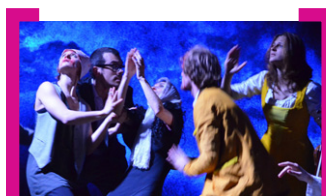
Ein Vorgeschmack auf Move Op!

Angenommen: Musik wäre die direkteste Sprache zwischen den Menschen und Nationen. Was erzählt Musik-Theater jetzt, wo „die Krise“ die Lebensbedingungen und Demokratien in Europa radikal bedroht? Was zeigt alternatives Musiktheater, nah an der Lebenswelt der Macher und des Publikums, entstanden unter Sparauflagen, Rechtsruck, aber auch in kreativen Gegenentwürfen? Move Op(era)! – Beweg Dich, (Oper)! – zeigt vielfältige Formen eines lebhaften Musiktheaters jenseits der großen Opernhäuser und Festivals. Move Op! ist ein Fest fürs Publikum, Plattform des Austauschs und Ort einer gemeinsamen, internationalen Arbeit als Gegenreaktion.