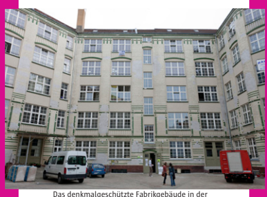
Das denkmalgeschützte Fabrikgebäude in der Karl-Marx-Straße 58

In der Karl-Marx-Straße 58 tut sich was – das Fabrikgebäude wurde umfassend saniert, entstanden sind moderne Gewerbeflächen auf insgesamt 7.000 m². Die Mieter dieser Flächen sind Unternehmen aus dem sozialen und kulturellen Bereich, wie die ZeitRaum GmbH, die dort eine Tages- und Beschäftigungsstätte für chronisch kranke Menschen eingerichtet hat, oder der Verein PROWO mit einer Betreuungseinrichtung, die eine Alternative zur psychiatrischen Klinik sein kann. Auf zwei Etagen sind außerdem 22 bezahlbare Ateliers entstanden, die durch das Atelierbüro im Kulturwerk des bbk berlin vermietet werden. Professionelle Künstler/-innen, die einen günstigen Raum zum Arbeiten suchen, konnten sich bewerben. In der „Kultstätte Keller“ will ein Berliner Kollektiv Raum für besondere Events und Projekte schaffen; es finden bereits Nachtflohmärkte, Varietéabende und Lesungen statt. Und im „Körperhaus“ kann man an Yoga- und Tanzkursen teilnehmen. Für die Zukunft ist außerdem die Einrichtung von professionellen Musikstudios geplant.