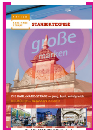
Titel der Standortbroschüre

Pünktlich zum Investorenrundgang im August 2013 erschien ein Standortexposé für die Karl-Marx-Straße. Interessierte Immobilienentwickler und Investoren erfahren hier alle wichtigen Fakten. Die Standortbroschüre ist beim Citymanagement der [Aktion! Karl-Marx-Straße] erhältlich, eine Kurzfassung finden Sie auch im Internet unter —> www.Aktion-KMS.de/projekte/handel/standortbroschuere/