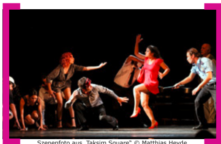
Szenenfoto aus „Taksim Square“

Die Karl-Marx-Straße als Festivalmeile: 15 Produktionen aus 13 Nationen zwischen Oper und Ritualshow. Sieben Tage zeigte die Neuköllner Oper, wie vielfältig Musiktheater sein kann, auch wenn es durch die politische wie ökonomische Krise in Europa bedingt unter schwierigsten Verhältnissen entstehen musste: Wie bei der „Zauberflöte“ – ohne Orchester, nur von sechs Sängerdarstellern aufgeführt, die mit ihrer Version von Mozarts bekanntester Oper begeisterten. Oder bei dem Musical „Taksim Square“ über den Aufstand in der Türkei, das ein Theater aus Istanbul vor vielen türkischstämmigen Zuschauern zur Uraufführung brachte. Für die Berliner Zeitung war klar: Mit Werken wie dem Musiktanztheater