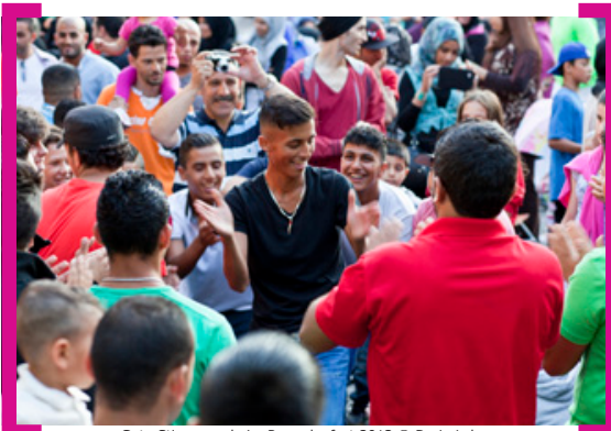
Gute Stimmung beim Ramadanfest 2013

In diesem Jahr wurde das Ramadanfest an der Karl-Marx-Straße zum fünften Mal gefeiert. Am 11. August 2013 luden das DAZ – Deutsch-Arabisches Zentrum für Bildung und Integration und seine 20 türkischen und arabischen Vereine sowie Piranha Kultur und die [Aktion! Karl-Marx-Straße] auf den Karl-Marx-Platz ein. Geboten wurden traditionelle und moderne Musik, ein weit gefächertes kulinarisches Angebot und viele Aktivitäten für Kinder. Der Karl-Marx-Platz füllte sich bei strahlendem Sonnenschein schnell und die Gäste feierten bis in den Abend hinein. Im kommenden Jahr findet das Ramadanfest auf dem dann umgebauten Platz der Stadt Hof statt und es wächst hoffentlich weiter, zieht neue Gäste und neue Unterstützer an.