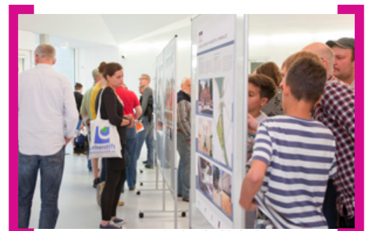
Neugierig werden die Infotafeln für den Gebietsteil Sonnenallee betrachtet

In der Quartierssporthalle auf dem Campus Rütli wurde am 26. August 2013 das Beteiligungsgremium Sonnenallee neu gewählt. Rund 100 Interessierte hatten sich am Abend zusammengefunden, um sich über die aktuellen Entwicklungen im Gebietsteil des Aktiven Zentrums und Sanierungsgebietes zu informieren. Die Planungen für den Lohmühlen- und Weichselplatz wurden diskutiert und ein neues Beteiligungsgremium gewählt. Die nun gewählten acht Mitglieder sind im Gebietsteil Sonnenallee wohnhaft, besitzen dort Eigentum oder arbeiten dort. Sie wollen die Bedürfnisse und Interessen der im Sanierungsgebiet „betroffenen“ Menschen vertreten. Die Internetseite des Beteiligungsgremiums finden Sie hier —> www.aktionsonnenallee.de