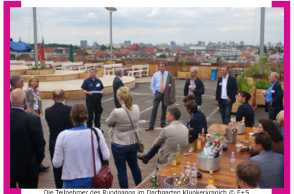
Die Teilnehmer des Rundgangs im Dachgarten Klunkerkranich