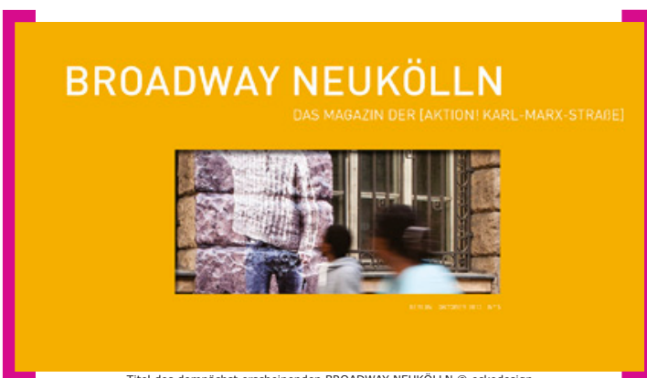
Titel des demnächst erscheinenden BROADWAY NEUKÖLLN © eckedesign

Einen schönen Herbstbeginn wünscht Ihnen Ihr Horst Evertz