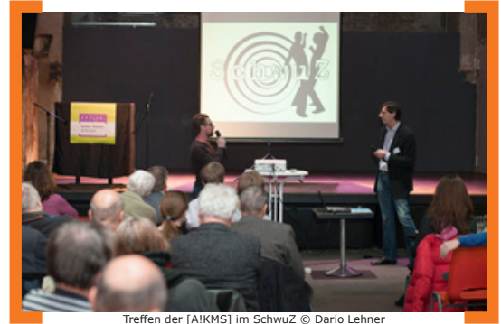
Treffen der [AIKMS] im SchwuZ

Bereits am 12. Februar informierten das SchwuZ und das Schwule Museum in einer Podiumsdiskussion mit der ehemaligen Bundesliga-Fußballerin Tanja Walter-Ahrens, dem Innenpolitischen Sprecher von Bündnis 90/Die Grünen Volker Beck und anderen Teilnehmern über die Lage in Russland. Für den 23. Februar 2014 hat das SchwuZ eine Demonstration vor der Russischen Botschaft angemeldet. Weitere Infos: -> www.schwuz.de