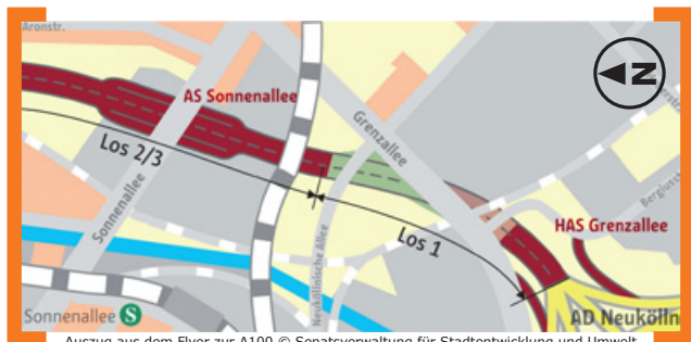
Auszug aus dem Flyer zur A100

Ab dem 24. Februar 2014 treten die Bauarbeiten am 16. Abschnitt der BAB A 100 in die nächste Phase, dann wird die Durchfahrt zur Grenzallee gesperrt und eine umfangreiche Umleitung des Verkehrs eingerichtet. Insbesondere die Sonnenallee wird zur Aufrechterhaltung des Verkehrs als Umleitungsstrecke benötigt. Die Sonnenallee wird auch nach der Fertigstellung eine eigene Anschlussstelle bekommen. Die derzeitigen Planungen für den Umbau der Karl-Marx-Straße sehen vor, dass ab dem Sommer 2014 der zweite Abschnitt zwischen Jonasstraße und Uthmannstraße umgebaut wird. Angesichts des Umfangs der Arbeiten, die BVG wird hier den Tunneldeckel der U7 sanieren, und der Enge in diesem Straßenabschnitt kann nur ein Fahrstreifen dauerhaft dem Fahrzeugverkehr zur Verfügung gestellt werden. Vorgesehen ist eine Einbahnstraßenregelung von Süd nach Nord. Hierzu muss auch eine Umfahrung für die Gegenrichtung ausgewiesen werden. Um nicht noch mehr Verkehr über die Sonnenallee zu leiten, soll die Umleitung großräumig vom Hermannplatz über die Hermannstraße und die Blaschkoallee geführt werden. Selbstverständlich werden wir Sie umgehend informieren, wenn die Zeiten und Sperrungen konkret werden.