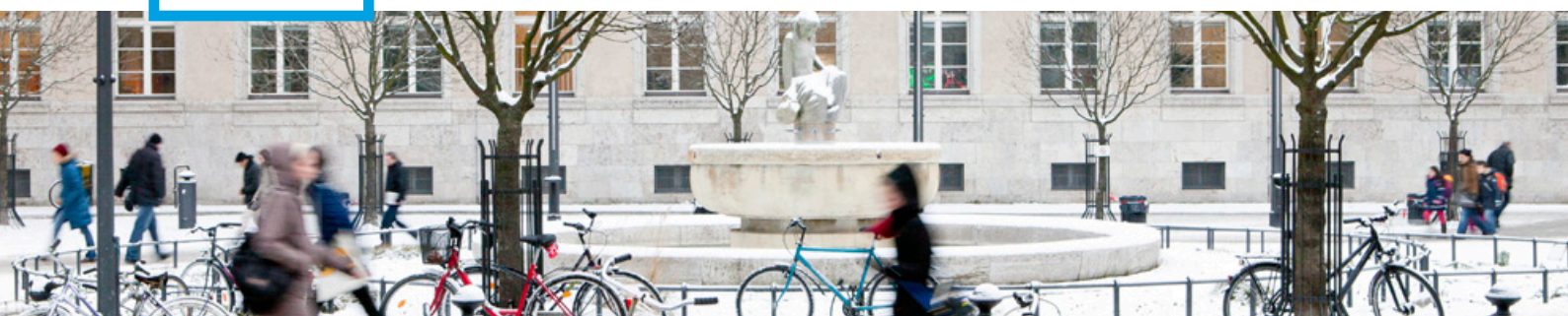
Winter an der Karl-Marx-Straße

Sehr geehrte Damen und Herren, liebe Freunde der [Aktion! Karl-Marx-Straße],