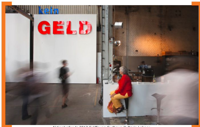
Aktionärsfonds 2013 Eröffnung Sudhaus

Werden Sie Aktionär der Karl-Marx-Straße! Zum 8. Mal legt die [Aktion! Karl-Marx-Straße] im Frühjahr 2014 den Aktionärsfonds auf. Im Laufe des Jahres wird der Platz der Stadt Hof (zukünftig Alfred-Scholz-Platz) fertig gestellt und kann zum Treffpunkt für alle Besucher der Karl-Marx-Straße werden. Die Projekte des Aktionärsfonds 2014 sollen zur Belebung dieser „neuen Mitte“ beitragen und den Platz nicht nur bei der Neuköllner, sondern auch bei der Berliner Bevölkerung bekannter machen. Ihre Ideen sind gefragt. Unter dem Motto „Platz da – Raum für Vielfalt“ werden temporäre Projekte wie z.B. Themenmärkte, Feste und Veranstaltungen gesucht. Auch Maßnahmen, die sich mit Bürgerpartizipation im Rahmen des Umbaus auseinandersetzen, sind denkbar. Im Rahmen der jeweiligen Projekte darf die optische Erscheinung des Platzes für die Dauer des Projektes temporär verändert werden, unzulässig sind jedoch bauliche Eingriffe. Grundsätzlich förderfähig sind aber investive Maßnahmen an Gebäuden und im öffentlichen Raum. Förderfähig sind auch Kooperationen von Gewerbetreibenden oder Eigentümern untereinander und die Vernetzung unterschiedlicher Partner aus den Bereichen Einzelhandel, Dienstleistungen oder Kultur. Gefragt sind Projekte, die einen eindeutigen Bezug zu Neukölln haben.