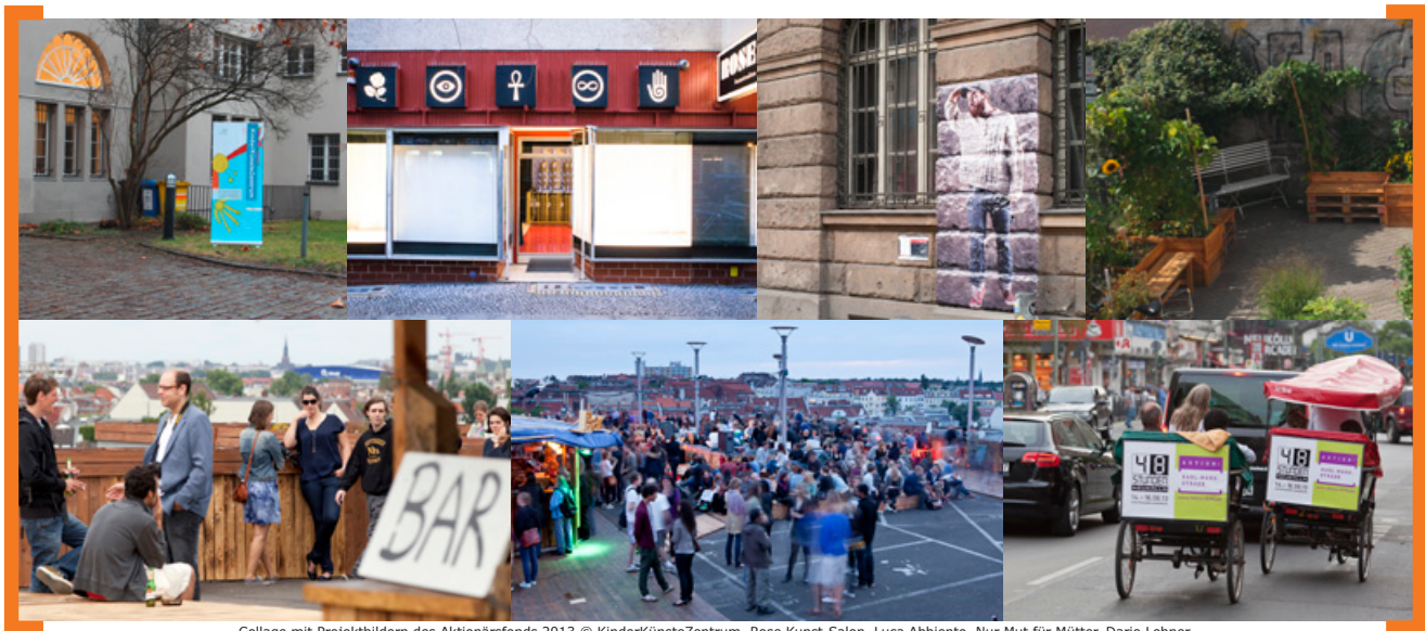
Collage mit Projektbildern des Aktionärsfonds 2013

Wir sehen uns in Neukölln, Ihr Horst Evertz