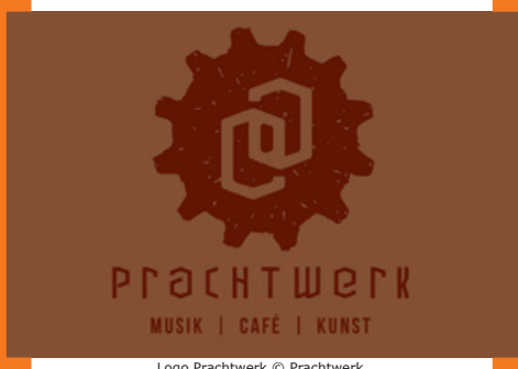
Logo Prachtwerk