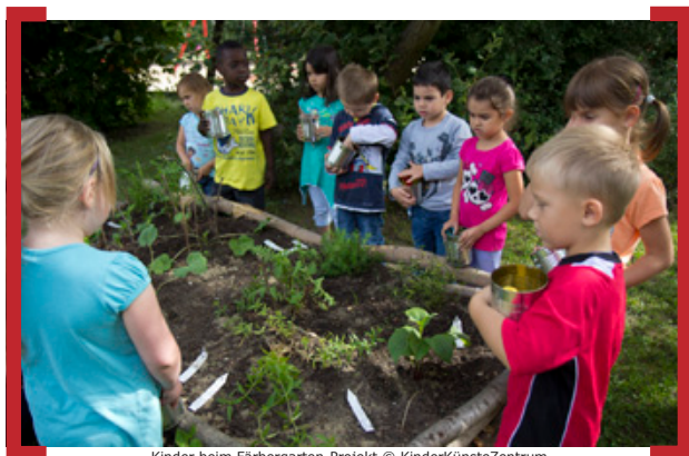
Kinder beim Färbergärten-Projekt

Alle Veranstaltungen sind kostenlos! -> www.kinder-kuenste-zentrum.de