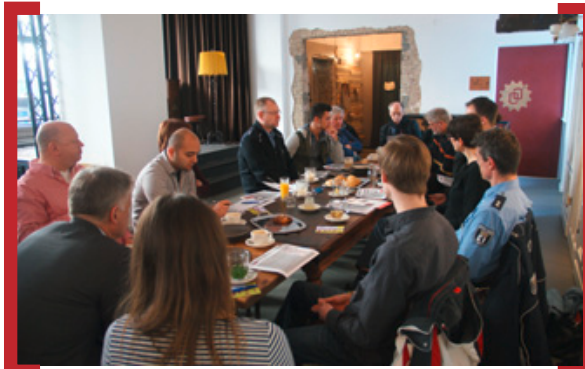
Händlerfrühstück im Prachtwerk