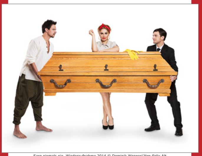
Sarg niemals nie, Wiederaufnahme 2014 © Dominik Wagner|Jörn-Felix Alt