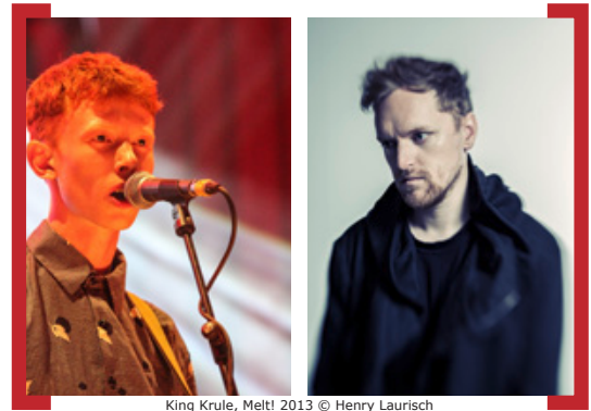
King Krule, Meltl 2013 S O H N

Der junge Brite Archy Marshall sorgte mit krudem Sprechgesang, unterlegt von cleanen, halligen Gitarrenriffs und minimalistischen Beats als KING KRULE 2013 für Furore. Im Heimathafen Neukölln spielt er am Mittwoch, den 9. April 2014 , um 21.00 Uhr. Die Karten kosten 21,50 EUR im Vorverkauf. Am Sonntag, den 13. April 2014 , um 21:00 Uhr folgt dann ein weiteres spannendes Konzert eines britischen Newcomers: S O H N , gegründet im Sommer 2012 spielte erste Konzerte beim niederländischen EURsonic-Festival oder beim SXSW in Texas. Spätestens seitdem er Lana Del Rey remixen durfte, ist S O H N in aller Munde. Die Karten kosten 20,50 EUR im Vorverkauf. -> www.heimathafen-neukoelln.de