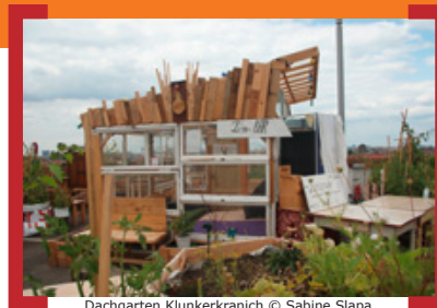
Dachgarten Klunkerkranich

Seit Ende März hat der beliebte Dachgarten Klunkerkranich seine Tore wieder geöffnet . Die Macher haben sich für das Frühjahr viel vorgenommen: das Bar-Angebot wird erweitert und ein Essensbereich kommt hinzu. Der Dachgarten wird grüner und größer. Während der kalten Tage hatte die Zuckmayer-Schule aus Neukölln eine Patenschaft für die Pflege der Pflanzen übernommen, so kamen sie sicher durch den Winter. Dachgarten Klunkerkranich, oberstes Parkdeck der Neukölln Arcaden, Karl-Marx-Straße 66, 12043 Berlin -> www.facebook.com/derklunkerkranich