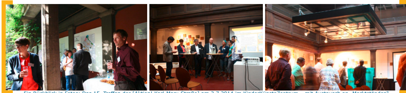
Ein Rückblick in Fotos: Das 15. Treffen der [Aktion! Karl-Marx-Straße] am 3.7.2014 im KinderKünsteZentrum – mit Austausch an „Marktständen“ zu unterschiedlichen Themen und einem Gesprächsforum mit Händlern der Karl-Marx-Straße → www.aktion-kms.de/aktiv/treffen-der-akms/

Kontakt: Susann Liepe, Sabine Slapa, Tel.: 030. 22 19 72 93, E-Mail: cm@aktion-kms.de . Alle Infos zum Bauablauf und den verkehrlichen Maßnahmen unter → www.aktion-kms.de/projekte/umbau-karl-marx-strasse/ .