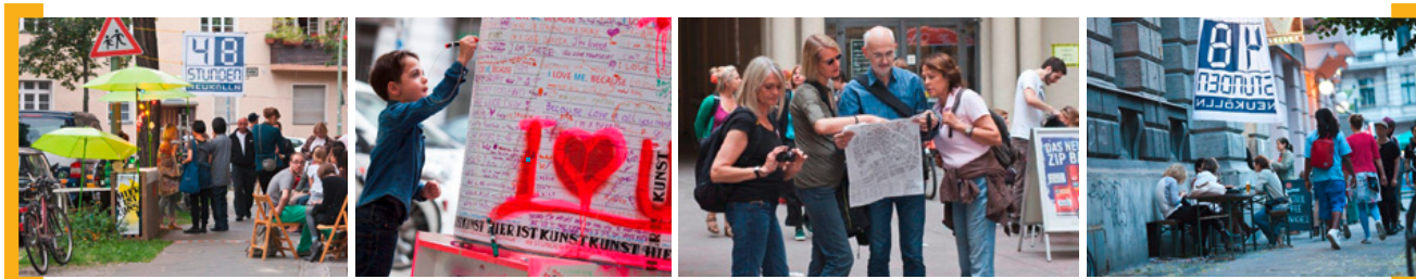
Ein Rückblick in Fotos: Impressionen von den 48 Stunden Neukölln vom 27. bis 29. Juni 2014

Umbau und Neugestaltung der Richard- und Ganghoferstraße: Nicht nur die Karl-Marx-Straße als Rückgrat des Zentrums wird umgebaut, sondern auch die Seitenstraßen, die vom bereits neugestalteten Alfred-Scholz-Platz (ehemals Platz der Stadt Hof) abgehen. Umbau und Neugestaltung der Richard- und Ganghoferstraße zwischen Berthelsdorfer- und Donaustraße werden erforderlich, um die Einfahrbereiche vom Platz entsprechend anzupassen. Zudem genügen die Fahrbahnen und Gehwege sowohl in der Ganghofer- als auch in der Richardstraße nicht mehr den aktuellen technischen Anforderungen. Unter anderem sind folgende Maßnahmen vorgesehen: Installation zusätzlicher Fahrradständer in der Nähe des Alfred-Scholz-Platzes, Verbesserung des Straßenbildes durch neue Baumpflanzungen in vergrößerten Baumscheiben in beiden Straßen, Ersetzen des Kopfsteinpflasters durch eine Asphaltdecke zur Lärminderung und besseren Befahrbarkeit in der Richardstraße, Verbreiterung der Gehwege um ca. einen Meter zur Erhöhung der Aufenthaltsqualität in der Ganghoferstraße, wodurch auch ausreichend Platz für Außengastronomie entsteht. Der Umbau erfolgt in zwei Abschnitten. Bis voraussichtlich Ende 2014 wird jetzt die Richardstraße umgestaltet. Im Frühjahr 2015 beginnt der Umbau der Ganghoferstraße, der ca. fünf Monate in Anspruch nehmen wird.