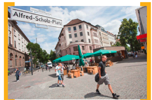
Nehmen Sie Platz – auf dem Alfred-Scholz-Platz

Wir sehen uns auf der Karl-Marx-Straße, Ihr Horst Evertz