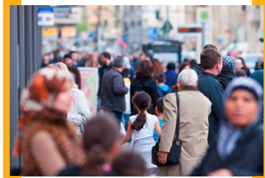
Der Umbau der Karl-Marx-Straße schafft mehr Raum für Fußgänger

Umbau der Karl-Marx-Straße: Bis zum Jahr 2021 wird die Karl-Marx-Straße neu. Aufbauend auf ihren bisherigen Qualitäten schafft der Umbau mehr Raum für Fußgänger, Radfahrer und Außengastronomie, neue Aufenthaltsqualität entsteht sowie ausreichend Platz für Handel, Begegnung und Erleben. Der erste Bauabschnitt im Süden der Karl-Marx-Straße wurde am 26. Oktober 2012 der Öffentlichkeit übergeben. In Kürze – nach Genehmigung seitens der Verkehrslenkung Berlin – wird mit dem zweiten anschließenden Bauabschnitt von der Ecke Jonasstraße bis zur Uthmannstraße begonnen. Gerechnet wird mit einer Bauzeit von ca. 80 Wochen. Die große Herausforderung besteht darin, dass zusätzlich zu den eigentlichen Straßenbauarbeiten die Abdichtung der Tunneldecke der U-Bahnlinie 7 durch die BVG erfolgt. Der Betrieb der U-Bahn wird hierdurch nicht beeinträchtigt. Zudem verlaufen in diesem Bereich auch zahlreiche Versorgungsleitungen, die, sofern erforderlich, ebenfalls direkt im Zuge der Straßenumbauarbeiten erneuert werden. Wichtig für alle Autofahrer: die Karl-Marx-Straße wird für längere Zeit (bis 2018) nur von Süden als Einbahnstraße befahrbar sein. Um die zu erwartenden Beeinträchtigungen so gering wie möglich zu halten, hat das Bezirksamt Neukölln ein Baustellenmanagement eingerichtet: Das Citymanagement der [Aktion! Karl-Marx-Straße] wird allen Gewerbetreibenden als Ansprechpartner zur Verfügung stehen und Hilfestellungen leisten, wo immer es möglich ist.