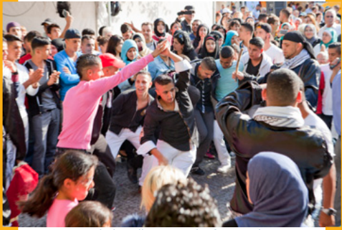
Interkulturelles Ramadanfest an der Karl-Marx-Straße

+++ RixStyleMarkt , 27. Juli, 31. August, 28. September und 26. Oktober 2014, jeweils 12.00 bis 18.00 Uhr. Markt für Berliner Unikate, Art, Design und Fashion vom traumpfad e.V. —> www.visitneukoelln.de . +++ Die Rixdorfer Nachrichtenschau und der RixStyleMarkt sind Projekte im Rahmen des Aktionärsfonds der [Aktion! Karl-Marx-Straße] 2014. —> www.aktion-kms.de/events/aktionarsfonds-projekte/ .