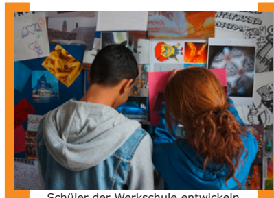
Schüler der Werkschule entwickeln Ideen für die Treppe

Ort: Neckarstraße. —> www.aktion-kms.de/projekte/schuelerworkshops/2014/ .