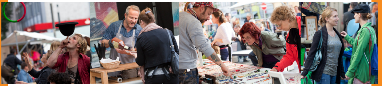
Impressionen von „Kultkölln – Jahrmarkt der Manufakturen“ auf dem Alfred-Scholz-Platz © Dario Lehner.