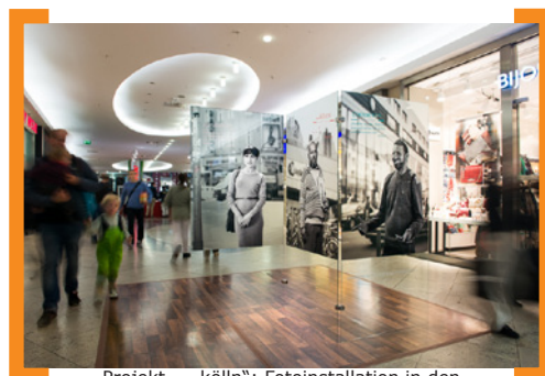
Projekt „... köln“: Fotoinstallation in den Neukölln Arcaden

—> www.Aktion-KMS.de/events/aktionarsfonds-projekte/ .