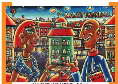
NACHTUNDNEBEL 2014

+++ 13. Kunst- und Kulturfestival NACHTUNDNEBEL am Samstag, 1.11.2014, 18.00 bis 24.00 Uhr, an 70 Orten in Nord-Neukölln. Sie sind herzlich eingeladen, bis tief in die Nacht an bekannten und noch unbekannten Orten die Vielfalt künstlerischen Schaffens in Neukölln zu entdecken. Erleben und genießen Sie bei einer Tour durch das nördliche Neukölln Einblicke in die Neuköllner Kunstszene. After-Show-Party ab 22.00 Uhr in der Villa Neukölln, Hermannstraße 233, 12049 Berlin, U-Bhf. Boddinstraße. —> www.nachtundnebel.info .