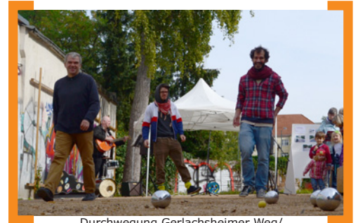
Durchwegung Gerlachsheimer Weg/Jan-Hus-Weg/Kirchgasse

—> www.qm-ganghofer.de/index.php/790-eroeffn-gerlachsheimer2014 .