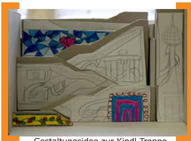
Gestaltungs-idee zur Kindl-Trepp (Schülerworkshop) © Anna Lena Wollny

+++ Der Bau der Kindl-Trepp hat begonnen. Mit ihr wird das ehemalige Kindl-Areal über die Neckarstraße besser an die Karl-Marx-Straße angebunden, wofür ein Geländesprung von etwa neun Metern Höhe überwunden werden muss. Die bei der Treppenkonstruktion entstehenden Mauerflächen, die von der Isar- und Neckarstraße aus gut sichtbar sind, werden gestaltet. Drei Schülerworkshops, jeweils begleitet von Künstlern und Architekten, haben hierzu Ideen und Vorschläge entwickelt (siehe unten). Weitere Infos zum Bau der Trepp unter