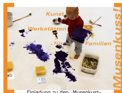
Einladung zu den „Musenkuss-Kunstwerkstätten“

+++ „Musenkuss! KunstWorkstätten für Familien mit kleinen Kindern“ , verschiedene Termine bis 19.12.2014 im KinderKünsteZentrum. Die Werkstätten werden von erfahrenen Künstlern und Pädagogen angeleitet. Die Teilnahme ist kostenfrei, eine Anmeldung unbedingt erforderlich. „Die Sinne“ KunstWorkstatt für Kinder von 3 bis 6 Jahren und ihre Eltern: Gemeinsam kochen, Farben aus Lebensmitteln herstellen, klingende Pappboxen bauen ... | Herbstferien-Workshop „Urban Gardening + Kunst“ für Kinder von 3 bis 6 Jahren und ihre Eltern: Säen und pflanzen, mit selbst hergestellten Pflanzenfarben arbeiten ... | Workshop „BabyArt“ für Kinder von ein bis zwei Jahren und ihre Eltern: Die Jüngsten experimentieren mit Farben und Materialien auf großformatigen Leinwänden. —> www.kinder-kuenste-zentrum.de/veranstaltungen/musenkuss01.html .