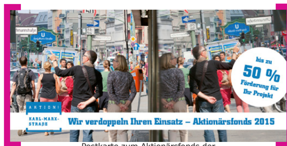
Postkarte zum Aktionärsfonds der [Aktion! Karl-Marx-Straße] 2015