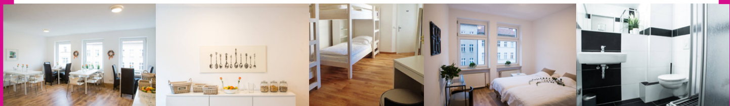
Das fertige Karl-Marx-Hostel