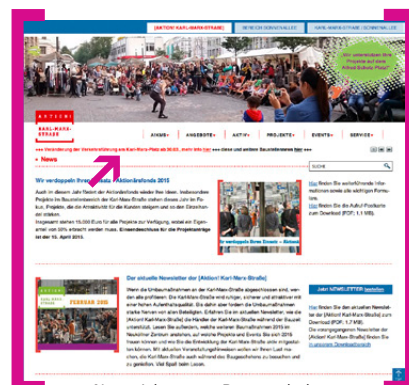
Newsticker zum Baugeschehen unter www.Aktion-KMS.de

Aktionärsfonds 2015 aufgelegt: Sie planen ein Projekt im Zentrum Neuköllns? Im Rahmen des Aktionärsfonds der [Aktion! Karl-Marx-Straße] verdoppeln wir Ihren Einsatz. Bewerben können Sie sich vor allem, wenn Sie Folgendes planen: a) kleinere Baumaßnahmen an und in Geschäften bzw. Gebäuden, b) Maßnahmen zur Profilierung und Qualifizierung Ihres Geschäftes (Marketing- oder Kundenbindungsmaßnahmen) oder c) Maßnahmen zur Belebung des öffentlichen Raums und von Plätzen.