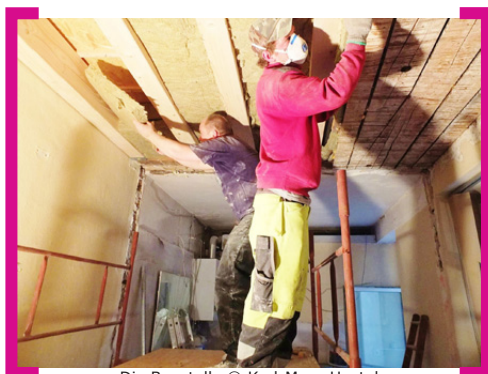
Die Baustelle

Zu Beginn werden 40 Betten angeboten, weitere sind geplant. Jedes Zimmer verfügt über ein großes, geräumiges Bad. Die Betreiber und Mitarbeiter des Karl-Marx-Hostels sind langjährige Neukölln-Liebhaber, Szene-Kenner und „könnten nicht leben, ohne den Wind, der [ihnen] Tag für Tag auf der Karl-Marx-Straße ins Gesicht weht.“ Natürlich lassen sie