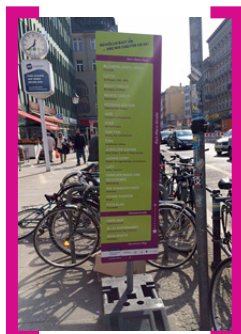
Wegweiser zu den Geschäften

Aktionärsfonds 2015 aufgelegt: Sie planen ein Projekt im Zentrum Neuköllns? Im Rahmen des Aktionärsfonds der [Aktion! Karl-Marx-Straße] verdoppeln wir Ihren Einsatz. Bewerben können Sie sich vor allem, wenn Sie Folgendes planen: a) kleinere Baumaßnahmen an und in Geschäften bzw. Gebäuden, b) Maßnahmen zur Profilierung und Qualifizierung Ihres Geschäftes (Marketing- oder Kundenbindungsmaßnahmen) oder c) Maßnahmen zur Belebung des öffentlichen Raums und von Plätzen.