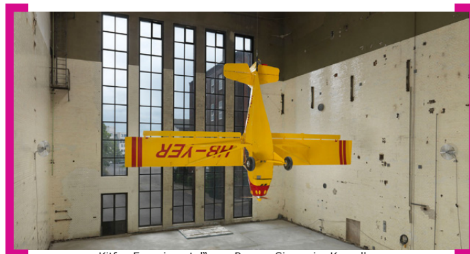
„Kitfox Experimental“ von Roman Signer im Kesselhaus des KINDL