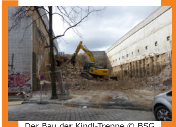
Der Bau der Kindl-Treppe

Sie werden die Last der Treppenanlage abtragen. Diese wird einen Geländesprung von etwa neun Metern Höhe überwinden und durch einen Aufzug auch einen barrierefreien Zugang schaffen. Somit rückt das Kindl-Gelände ins Zentrum Neuköllns, da es von der Karl-Marx-Straße aus über die Neckarstraße wesentlich besser zu erreichen sein wird. Die Bauarbeiten sollen im Sommer 2015 abgeschlossen sein.