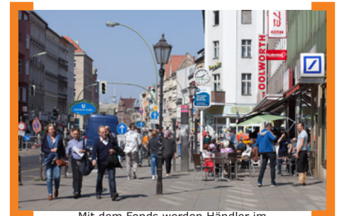
Mit dem Fonds werden Händler im Baustellenbereich unterstützt

Infos zu den ausgewählten Projekten finden Sie unter —> www.aktion-kms.de/events/aktionarsfonds-projekte/ .