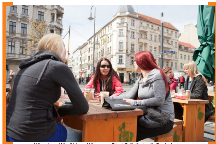
Mitreden, Mitwählen, Mitessen: Die LG lädt ein

Die Lenkungsgruppe, eine Gemeinschaft von lokalen Akteuren, Anwohner/-innen und Gewerbetreibenden, begleitet den Entwicklungsprozess der Karl-Marx-Straße mit eigenen Ideen, Vorschlägen und Aktionen. Alle zwei Jahre wird sie neu gewählt – Sie sind herzlich eingeladen, sich mit ihren Wünschen einzubringen, für einen Platz in der Lenkungsgruppe zu kandidieren und/oder Ihre Interessensvertreter zu wählen. Die Lenkungsgruppe braucht Sie und Ihre Ideen für die Zukunft der Karl-Marx-Straße und freut sich über neue Mitglieder. Kommen Sie zur großen Bürgertafel und zur Wahl der Lenkungsgruppe. An vier Tischen können Sie gemeinsam mit den bereits aktiven Mitgliedern der Lenkungsgruppe diskutieren und essen. Unter —> www.Aktion-KMS.de/wahl/ finden Sie den Bewerberbogen. Bewerbungen für einen Sitz in der Lenkungsgruppe sind bis zum 11. Mai um 18.00 Uhr während der Veranstaltung möglich. Wenn Sie Ihr Profil online stellen wollen, senden Sie Ihren Bewerberbogen bitte rechtzeitig bis zum 8. Mai 2015 um 12.00 Uhr an die BSG. Wir ergänzen Ihre Daten (ohne Adress- und Kontaktdaten) dann unter www.aktion-kms.de/aktiv/lenkungsgruppe/kandidat_innen-der-lenkungsgruppe/ .