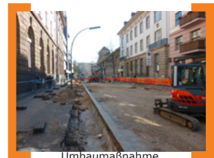
Umbaumaßnahme Ganghoferstraße

+++ Die Umbaumaßnahmen in der Ganghoferstraße haben Ende März 2015 begonnen. Ziel ist es, die Anschlussstelle an den umgebauten Alfred-Scholz-Platz anzupassen sowie die Gehwege zu verbreitern und zusammen mit der Fahrbahn zu erneuern. Neu ist, dass der Baustellenbereich geringfügig erweitert wird, so dass die Fahrbahn bis zur Kreuzung Donaustraße erneuert werden kann. Die Baumaßnahme endet voraussichtlich im Juli 2015. —> www.aktion-kms.de/projekte/umbau-ganghoferstrasse/ .