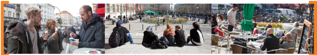
Frühling auf der Karl-Marx-Straße

Wir wünschen Ihnen trotz der Baustellen viel Spaß auf der Karl-Marx-Straße, Ihr Team der [Aktion! Karl-Marx-Straße]