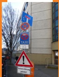
Neue Taxihalte Rollbergstraße

ist ein Gewinn für den Bereich Karl-Marx-Straße. Aufgrund des hohen Besucherverkehrs, insbesondere an den Wochenenden, entstehen aber auch Belastungen für die Anwohner. Die Betreiber des SchwuZ waren von Anfang an um gute Nachbarschaft bemüht und auf der Suche nach Lösungen für die aufgrund des hohen Publikumsverkehrs entstehenden Probleme. Seit 2014 tagt ein Runder Tisch, an dem alle Beteiligten in regelmäßigen Abständen zusammenkommen. Neben den Betreibern des SchwuZ sind dieses Anwohner, das Stadtentwicklungsamt des Bezirksamtes Neukölln, die Straßenverkehrsbehörde, die Polizei, die Taxi-Innung und die BSG.