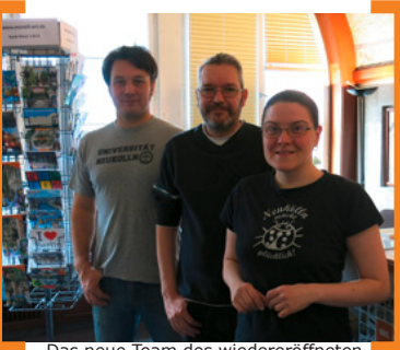
Das neue Team des wiedereröffneten NIC

+++ Das NIC Neukölln Info Center im Rathaus Neukölln wurde wiedereröffnet: