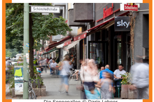
Die Sonnenallee

Im Rahmen des Bundesprogramms „Bildung, Wirtschaft, Arbeit im Quartier“ (BIWAQ) reichten 128 Kommunen Projektvorschläge ein, von denen ein unabhängiges Gutachtergremium 74 Kommunen für die zweite Wettbewerbsstufe auswählte, darunter Neukölln. Für die zweite Wettbewerbsphase hat die Wirtschaftsförderung des Bezirksamtes Neukölln einen detaillierten Antrag ausgearbeitet und im März 2015 eingereicht. Bei Antragsgenehmigung kann das Projekt vom 1. Juli 2015 bis zum 31. Dezember 2018 realisiert werden. Es besteht aus fünf Teilprojekten, die jeweils durch lokale Partner umgesetzt werden: a) Kreativwirtschaft, b) Modewirtschaft, c) die Entwicklung der Sonnenallee, d) Schlüsselimmobilien und e) die Stärkung des Kunst- und Kulturfestivals „48 Stunden Neukölln“. Das Fördervolumen beträgt 1,8 Millionen Euro. Hinzu kommt ein Eigenanteil des Bezirksamtes Neukölln von 200.000 Euro.