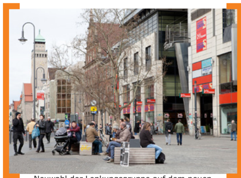
Neuwahl der Lenkungsgruppe auf dem neuen Alfred-Scholz-Platz

Kontakt: Für Fragen zur Wahl wenden Sie sich gerne an die BSG Sanierungsbeauftragte des Landes Berlin, Prozesssteuerung [Aktion! Karl-Marx-Straße], Karl-Marx-Straße 117, 12043 Berlin, Tel.: 030. 68 59 87 71, E-Mail: info@aktion-kms.de .