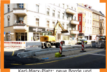
Karl-Marx-Platz: neue Borde und Mittelinseln

+++ News zum Umbau der Karl-Marx-Straße: Nach Beendigung der Abdichtung der U-Bahn-Tunneldecke im Abschnitt zwischen Jonasstraße und Karl-Marx-Platz auf der Ostseite sowie zwischen Thomasstraße und Uthmannstraße auf der Westseite wurde die Baustelle auf der Karl-Marx-Straße Ende März 2015 verlegt. Seitdem sind auf Höhe des Karl-Marx-Platzes wieder beide Straßenseiten befahrbar. Dafür ist die Karl-Marx-Straße während der Umbauzeit in diesem Bereich über die Thomasstraße nicht mehr erreichbar. Aber es gibt gute Nachrichten: Im gesamten genannten Bereich zeichnen sich die Ergebnisse bereits ab. So sind Borde und Mittelinseln gesetzt und bis Juni 2015 wird eine ganze Gehwegseite komplett mit Laternen etc. fertig gestellt sein. Die Hälfte dieses Bauabschnitts der Karl-Marx-Straße wird dann geschafft sein! Immer auf dem neusten Stand unter —> www.aktion-kms.de/baustellennews/ .