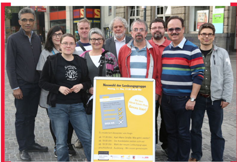
Die Mitglieder der Lenkungsgruppe nach der Wahl am 11. Mai 2015

+++ Kontakt: lenkungsgruppe@aktion-kms.de . —> www.Aktion-KMS.de/aktiv/lenkungsgruppe/