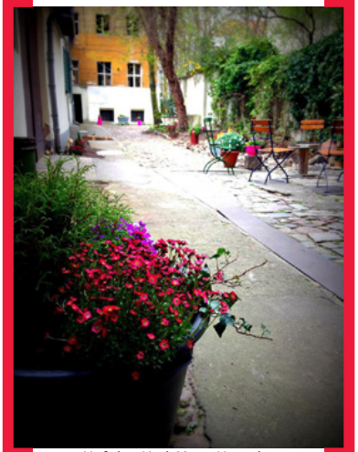
Hof des Karl-Marx-Hostels, Karl-Marx-Str. 176

+++ Der SchwuZ e.V. lädt Nachbarn, SchwuZ-Mitarbeiter, Vereinsmitglieder und Gäste zu einem Sommerfest ein. Da vor den Türen des Clubs in der Rollbergstraße noch gebaut wird, wird am 15. August 2015 von 14.00 bis 22.00 Uhr auf dem Alfred-Scholz-Platz gefeiert – mit Musik, live und von DJs. +++ Weitere Infos erhalten Sie in den kommenden Newslettern und unter —> www.aktion-kms.de/events/aktionarsfonds-projekte/ .