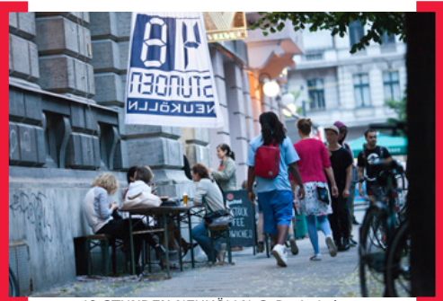
48 STUNDEN NEUKÖLLN

Einladung zum Kunst- und Kulturfestival 48 STUNDEN NEUKÖLLN vom 26. bis 28. Juni 2015: Berlins größtes freies Kunstfestival findet wieder am letzten Juni-Wochenende in Nord-Neukölln statt. Unter dem Motto „S.O.S. – Kunst rettet die Welt“ laden unzählige Veranstaltungen, offene Ateliers, Galerien und besondere Orte in der Zeit von Freitag,