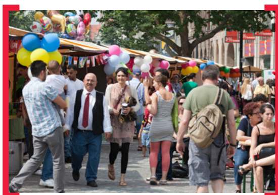
Interkulturelles Ramadanfest 2014