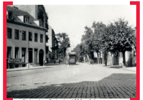
Richardstraße in der 1920er Jahren