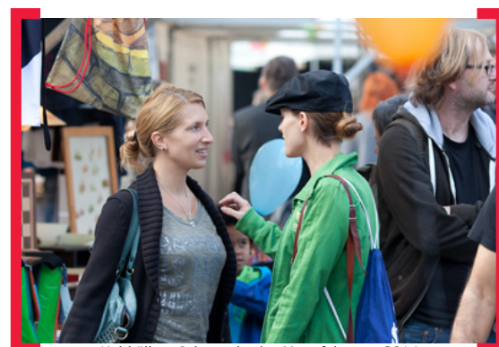
Kultkölln – Jahrmarkt der Manufakturen 2014

Wir wünschen Ihnen viel Spaß auf der Karl-Marx-Straße, Ihr Team der [Aktion! Karl-Marx-Straße]