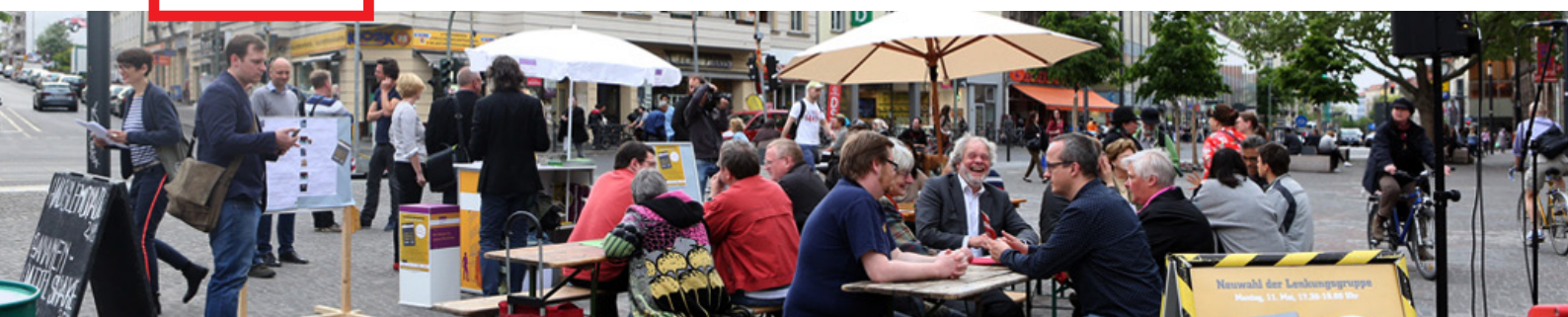
Wahl der Lenkungsgruppe auf dem Alfred-Scholz-Platz

Sehr geehrte Damen und Herren, liebe Freunde der [Aktion! Karl-Marx-Straße],