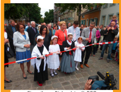
Einweihung Richardstr.