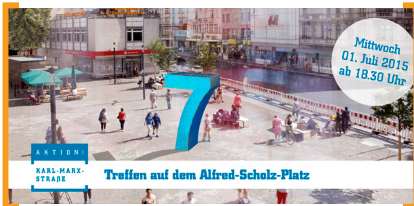
7 Jahre [Aktion! Karl-Marx-Straße]

Zur Feier von 7 Jahren [Aktion! Karl-Marx-Straße] ist dieses Mal alles anders und es gibt mindestens 7 Gründe, nicht nur in die Tiefe, sondern auch raus- und in die Höhe zu gehen: Treffpunkt ist um 18.30 Uhr auf dem Alfred-Scholz-Platz und der erste Programmpunkt führt uns auf ein Parkhaus zur Kreativagentur Hi-Res!, die als ihren dritten Standort neben London und New York ganz bewusst die Karl-