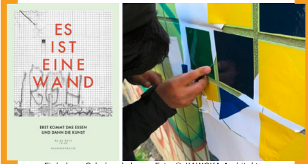
Einladung Schulworkshops, Foto © KAWOKA Architekten

Das Festival Junge KunstNK, das Programm der 48 STUNDEN NEUKÖLLN für und von Kindern und Jugendlichen, wird am 26. Juni 2015 um 13.00 Uhr eröffnet von den Schulworkshops der [Aktion! Karl-Marx-Straße] 2015 in der Neckar-/Ecke Isarstraße. Unter dem Titel „Es ist eine Wand“ haben Schüler Neuköllner Schulen zusammen mit Künstlern in drei Workshops Gestaltungsvorschläge für die mehr als 100 Meter lange Fliesenwand der Vollguthalle der ehemaligen Kindl-Brauerei erarbeitet. Ab 9.00 Uhr kleben die Schüler die ausgewählten Entwürfe gemeinsam mit den Künstlern sowie Anwohnern und Interessierten auf die Wand. Höher gelegene Elemente werden von Fassadenkletterern angebracht. Ab 13.00 Uhr wird das neue Kunstwerk bei einem gemeinsamen Essen an einer langen Tafel gefeiert. → www.aktion-kms.de/projekte/schuelerworkshops/