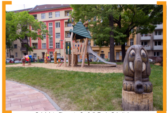
Spielplatz Finowstraße 6

die Bevölkerung verändert, wie sehen die Prognosen im Detail aus und wie geht man mit diesen Veränderungen um? Um für die Beantwortung dieser Fragen und für die weitere städtebauliche Planung eine belastbare Grundlage zu haben, hat der Bezirk Neukölln die Erstellung einer Wohn- und Infrastrukturuntersuchung in Auftrag gegeben. Bei der Infoveranstaltung stellt Ihnen das Stadtentwicklungsamt Neukölln gemeinsam mit dem Büro für Stadtplanung, -forschung und -erneuerung (PFE) die Ergebnisse der Studie vor. Zeit: Dienstag, den 7. Juli 2015, 18:00 bis 20:00 Uhr. Ort: Rathaus Neukölln, Karl-Marx-Straße 83, Wetzlarzimmer (Raum A 203). Weitere Infos → www.KMS-Sonne.de