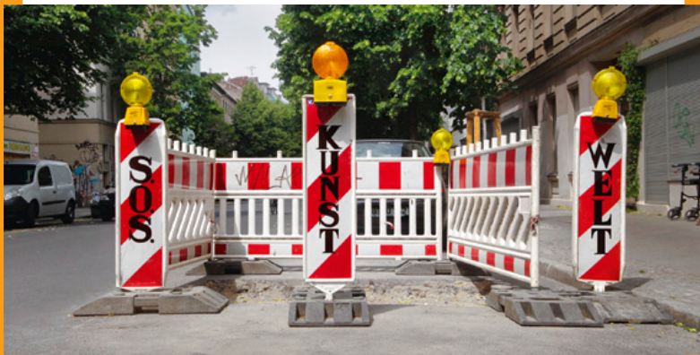
48 STUNDEN NEUKÖLLN, Grafik: thomas lehner.com

Veranstaltungen entlang der Karl-Marx-Straße im Rahmen der 48 STUNDEN NEUKÖLLN vom 26. bis 28. Juni 2015: Unter dem diesjährigen Motto „S.O.S. – Kunst rettet Welt“ präsentiert das größte freie Kunstfestival Berlins rund 350 künstlerische Projekte an etwa 220 Orten in Nord-Neukölln. Zahlreiche Veranstaltungsorte liegen entlang der Karl-Marx-Straße: Im ersten Obergeschoss der Neukölln Arcaden (Karl-Marx-Straße 66) wird die zentrale Ausstellung zum Festivalthema präsentiert. Viele weitere Orte und Plätze entlang der Neuköllner Magistrale werden mit Musik, Theater, Performances und Ausstellungen bespielt. So organisiert etwa der Kulturdachgarten Klunkerkranich