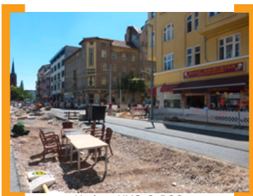
Umbau KMS