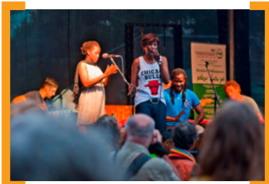
Sister Fa, Ramadanfest 2014