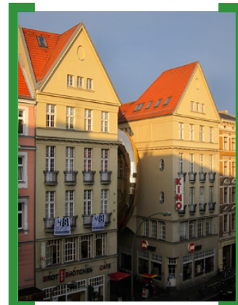
Passage Neukölln mit RINGdeLUXE von Canevacci/Wüste.

am 10. und 11. September 2011, Führungen z.B. durch die Passage Neukölln und das Stadtbad Neukölln. Weitere Infos unter —> www.tag-des-offenen-denkmals.de/laender/be/329/12462/?page=2 .