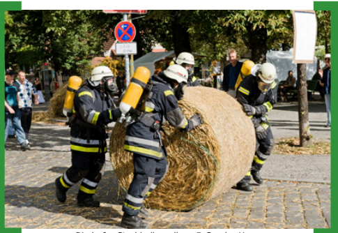
Rixdorfer Strohhallenrollen.

am 10. September 2011 von 14.00 bis 22.00 Uhr auf dem Richardplatz. Weitere Infos unter —> www.popraci.de