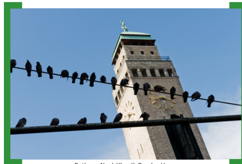
Rathaus Neukölln.

Führungen auf den Turm des Rathauses Neukölln, bis 28. Oktober 2011, jeweils mittwochs 11.00, 11.30 und 12.00 Uhr sowie freitags 16.00, 16.30 und 17.00 Uhr, Treffpunkt am Brunnen vor dem Rathaus (U7 Rathaus Neukölln). Infos und Anmeldung unter 030. 76 68 95 75.