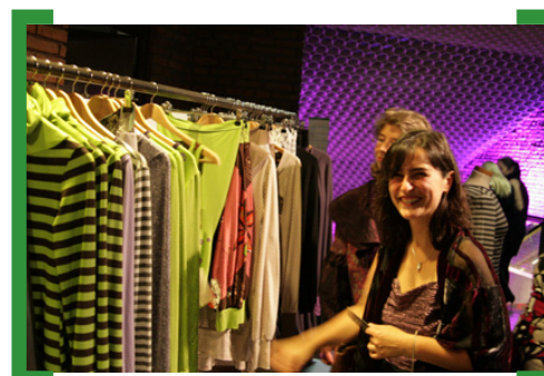
Fashion Weekend Neukölln in der Alten Post 2008.

am 30. September und 1. Oktober 2011 im Heimathafen im Saalbau Neukölln, Karl-Marx-Straße 141. Weitere Infos unter —> www.nemona.de/neukoellnfashionweekend.html .