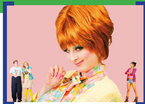
Frau Zucker will die Weltherrschaft

Familiengrusrical in der Neuköllner Oper – Frau Zucker will die Weltherrschaft Was nur wenige Menschen wissen: In jedem Kind steckt so viel Energie wie in 400 Millionen Tonnen Rohöl. Frei nach den Gebrüder Grimm haben die Erfolgsautoren Wolfgang Böhmer und Peter Lund ein Musical für die ganze Familie geschrieben, das wieder einmal beweist, dass ein kluges Kind sich nur auf eines wirklich verlassen kann: auf sich selber. Uraufführung am 13. Oktober 2011, 20.00 Uhr, in der Neuköllner Oper. Weitere Infos unter → www.neukoellneroper.de