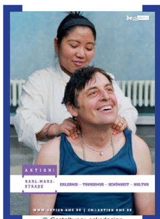
© Gestaltung: eckedesign

Infos und Anmeldung unter 030.76 68 95 75. Teilnahmekosten: 1,00 EUR