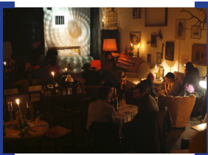
Probübühne des zuhause e.V.

Im Vollgutlager der Alten Kindl-Brauerei tut sich endlich was! Auf insgesamt 30.000 qm wird hier ein Kultur- und Kreativstandort entwickelt, der Raum für Künstler und Kreative schaffen soll. Der Raum bietet viel Platz für kulturelle Veranstaltungen und Präsentationen sowie für den Bezirk Neukölln nachhaltige Aus- und Weiterbildungsmöglichkeiten. Im ersten Untergeschoss hat der Verein zuhause e.V. bereits seine Arbeit aufgenommen. Neben Atelierräumen und einer Werkstatt betreibt der Verein hier eine Theaterprobühne.