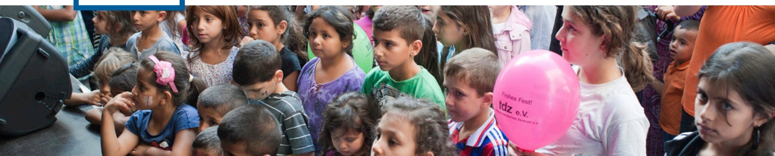
Kinder beim Ramadanfest auf der Karl-Marx-Straße 2011

Sehr geehrte Damen und Herren, liebe Freunde der [Aktion! Karl-Marx-Straße],