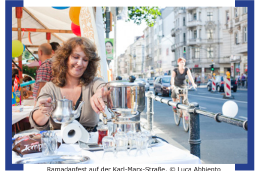
Ramadanfest auf der Karl-Marx-Straße

Am 2. und 3. September, nach dem Ende des Ramadan, wurde der Platz der Stadt Hof zum Treffpunkt der verschiedenen Kulturen in Neukölln. Das Türkisch-Deutsche-Zentrum (TDZ) und das Deutsch-Arabisches-Zentrum (DAZ) veranstalteten in Zusammenarbeit mit dem Citymanagement der [Aktion! Karl-Marx-Straße] für die Bewohner und Familien aus Neukölln und auch aus Berlin sowie für alle Kultur-Interessierten das interkulturelle Ramadanfest. Marktstände boten den Besuchern eine Mischung aus kulinarischen Besonderheiten, traditionellen Bekleidungsständen und vielen Spielangeboten wie Dosenwerfen, Glücksraddrehen und Hüpfburg für Kinder. Einer großen Beliebtheit bei den Kindern erfreuten sich die Schminkmöglichkeiten und Hennabemalungen sowie die Modellierung von Figuren aus Luftballons. Neben dem bunten Treiben an den Ständen sorgte ein vielfältiges Bühnenprogramm aus orientalischer Musik, türkischem Pop und Rock, Streetdance-Darbietungen, Flamencotanz und arabischen Tänzen für musikalische Unterhaltung. So gestalteten unter anderem die OHO-Band der Otto-Hahn-Schule, die Urban-Music-Show von Morris Perry sowie die türkische Rockband „Konveks“ das Bühnenprogramm. Abgerundet wurde das Fest durch ein weiteres Highlight, die fantasievoll gekleideten Stelzenläufer, die durch das Publikum liefen.