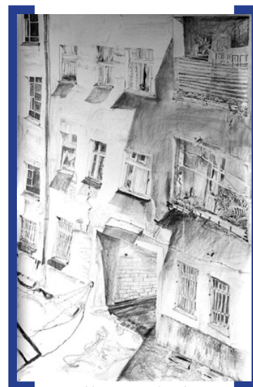
Die Einfahrt, 2008, Graphit auf Papier © Juliane Daldrop

Viel Spaß auf der Karl-Marx-Straße wünscht Ihnen Horst Evertz