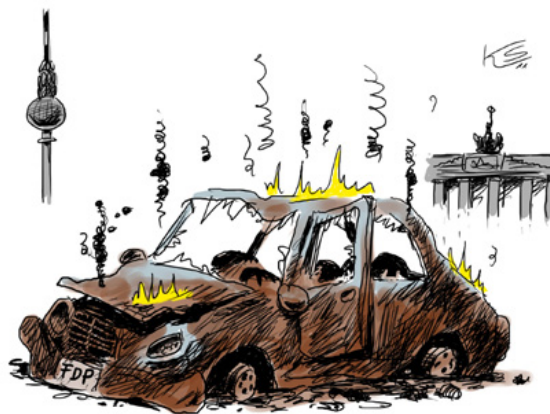
„Abgefackelt“