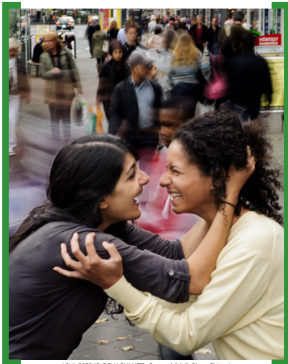
LILA RISIKO SCHACHMATT- Szenenbild