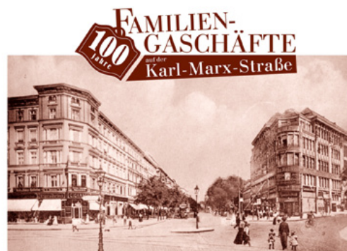
Ein Dokumentarfilm von Jose-Fernando Andrade und Sasha Goloborodko

Die Termine sind: 111 Jahre Hohenzollern Apotheke (Karl-Marx-Straße 168) am 10.11.2011 um 19:00 Uhr, 84 Jahre Kropp Feinkost (Karl-Marx-Straße 82) am 12.11.2011 um 20:00 Uhr und 34 Jahre Kneipe auf dem Karl-Marx-Platz (Karl-Marx-Straße 183) am 15.11.2011 um 17:00 Uhr.