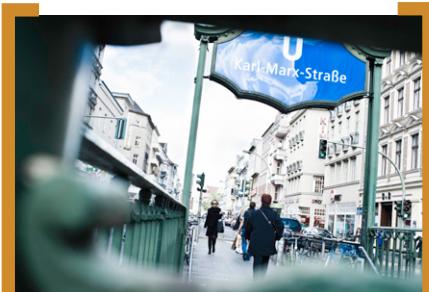
U-Bahnhof Karl-Marx-Straße