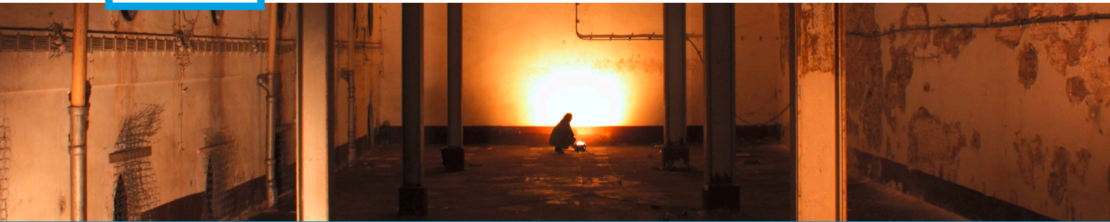
Vollgutlager auf dem Gelände der ehemaligen Kindl-Brauerei