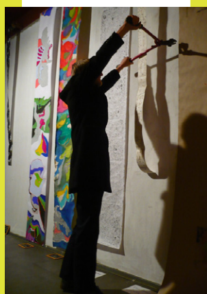
Spy & Win

„Musik verbindet“ vom Konservatorium für Türkische Musik: Türkische Musikgruppen und Berliner Nachwuchskünstler bieten in ihren Konzerten türkische