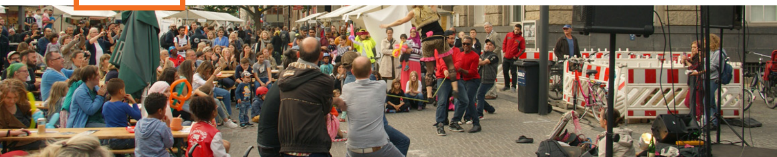
Kultkölln auf dem Alfred-Scholz-Platz