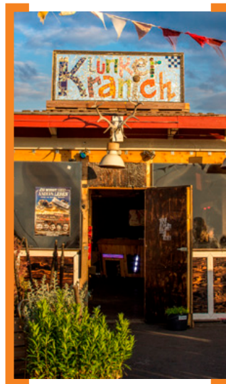
Auch im Herbst bleiben die Türen des Klunkerkranichs geöffnet

Klunkerkranich auf dem Dach der Neukölln Arcaden, Karl-Marx-Straße 66, Eingang Post/Bibliothek, mit dem Fahrstuhl in die 5. Etage. —> www.klunkerkranich.org