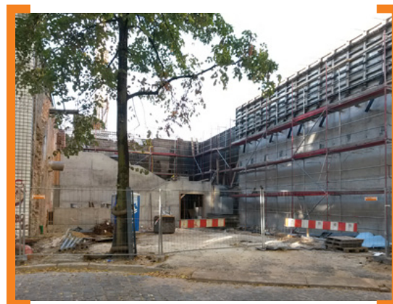
An der Kindl-Treppe geht es voran

Derzeit befinden sich die Bauarbeiten an der Isarstraße und der neuen Kindl-Treppe in vollem Gang. Bis Ende Oktober sollen die Baumaßnahmen an der Treppe soweit abgeschlossen sein, dass die Anschlussarbeiten und der Bau der Wegeverbindung vom Kindl-Gelände und der Isarstraße zur Treppe erfolgen können. Darauf folgend sind im Frühjahr 2016 die Arbeiten für eine künstlerische Gestaltung der Treppe vorgesehen. Das Ziel ist es, die Treppe möglichst am 21.5.2016, zum Tag der Städtebauförderung öffentlich einweihen zu können.