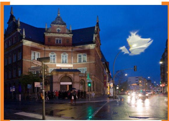
Die Alte Post sucht neue Impulse