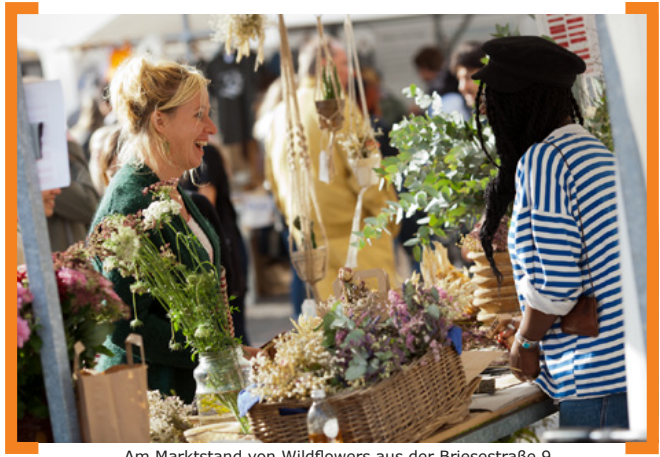
Am Marktstand von Wildflowers aus der Briesestraße 9