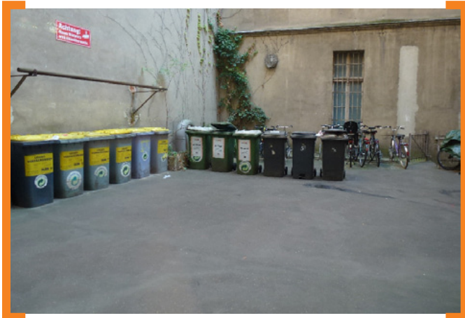
Vielerorts besteht Potential zur Entsiegelung und Hofgestaltung