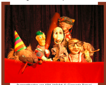
Puppentheater von K&K VolkArt

der Gestaltung einer Bistro-Wand durch ein Live-Painting von Peachbeach. Genießen Sie nach diesem „nullten“ Geburtstag fortan Espresso und frisches Streetfood aus regionalen Zutaten. → www.facebook.com/pages/Rixbox-Espresso-Food/399221523538152 . Die Rixdorfer Nachrichtenschau – Das neue Schau-Format auf dem Alfred-Scholz-Platz findet diesen Sommer regelmäßig statt. Im Open-Air-Puppentheater von K&K VolkArt mit bekannten Personen und „schonungsloser Aufklärung“ wird das Stück „König Buschi, Bausteinrat Blase und der SUPERGAU!“ gezeigt – das nächste Mal während der 48 Stunden Neukölln am 28.6.2014 um 18.00 Uhr. → www.volkart.eu/News/allgemein . In den folgenden Newslettern berichten wir jeweils über aktuelle Märkte und Veranstaltungen auf dem Alfred-Scholz-Platz.