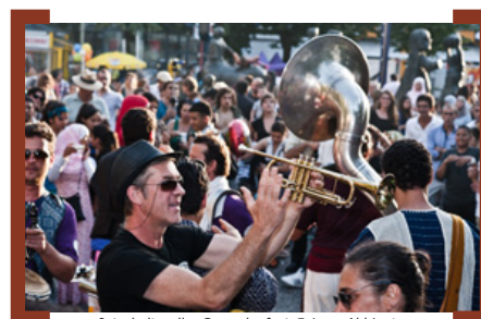
Interkulturelles Ramadanfest

„Die Nächte des Ramadan“ finden vom 29.6. bis 31.7.2014 an verschiedenen Orten in Berlin statt. Weitere Programmpunkte an der Karl-Marx-Straße sind die Konzerte GEMILANG RAMADHAN am 6.7.2014 und DIWAN DER KON-TINENTE am 11.7.2014, jeweils im Heimathafen Neukölln, Karl-Marx-Straße 141, U-Bhf. Karl-Marx-Straße, U7. Das komplette Programm unter → www.piranhakultur.de/event/events_2014/naechte_des_ramadan .