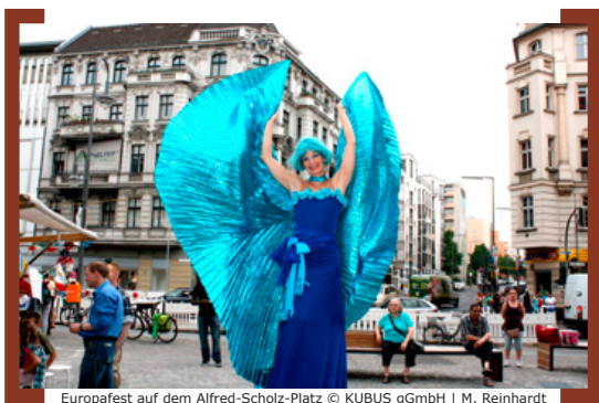
Europafest auf dem Alfred-Scholz-Platz

Inzwischen wurden auch die erforderlichen Asphaltarbeiten an der angrenzenden Karl-Marx-Straße durchgeführt, mit denen der Höhenunterschied zwischen dem neuen Platz und der Fahrbahn beseitigt wurde.