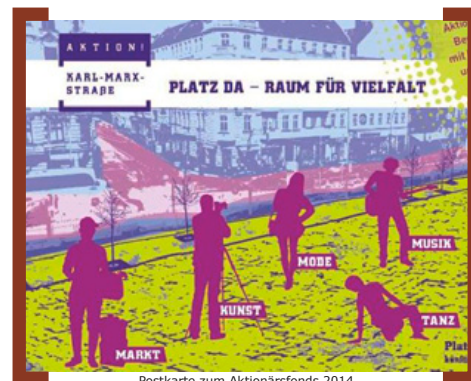
Postkarte zum Aktionärsfonds 2014

Auch der Aktionärsfonds der [Aktion! Karl-Marx-Straße] steht 2014 ganz im Zeichen des Alfred-Scholz-Platzes. Unter dem Motto "Platz da – Raum für Vielfalt" waren Projekte gesucht, die zur Belebung des Platzes als „neue Mitte“ des Neuköllner Bezirkszentrums beitragen. Eine Jury aus Vertretern der Lenkungsgruppe, dem Beteiligungsgremium der [Aktion! Karl-Marx-Straße], und einem Vertreter des Bezirksamtes Neukölln von Berlin wählte im April 2014 aus den eingereichten Projekten diejenigen zur Förderung aus, die eine interessante Bespielung des Platzes versprachen. Bereits stattgefunden hat am 7.6.2014 die Eröffnung der Rixbox, dem neuen Bistro auf dem Alfred-Scholz-Platz , mit einem „Urban Art Event“, inklusive