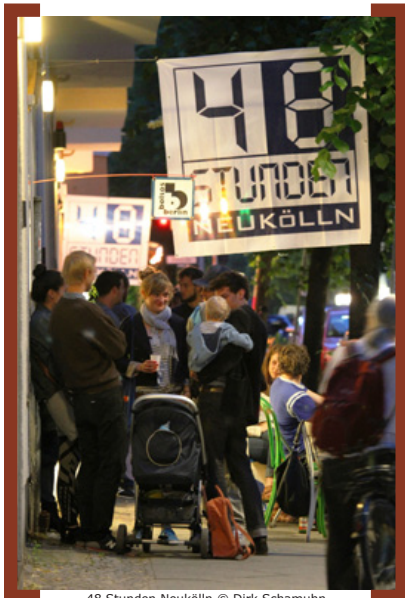
48 Stunden Neukölln

Berlins größtes dezentrales Kunstfestival findet vom 27. bis 29.6.2014 wieder in Nord-Neukölln statt. Unter dem Jahresthema „Courage.“ laden ca. 250 Veranstaltungen und rund 100 Offene Ateliers und Galerien in der Zeit von Freitag 19.00 Uhr bis Sonntag 19.00 Uhr zu vielfältigen kulturellen Angeboten ein. Zahlreiche Veranstaltungsorte liegen auch in diesem Jahr wieder an der Karl-Marx-Straße: In den Neukölln Arcaden bietet der Kulturdachgarten „Klunkerkranich“ auf den Parkdecks 5 und 6 künstlerische Aktionen an. Im 1. Obergeschoss der Arcaden befindet sich die zentrale Ausstellung zum Thema Courage. Am 27.6.2014 um 19.00 Uhr wird dort das Kunstfestival, u.a. durch Bezirksstadträtin Dr. Franziska Giffey, eröffnet. Viele weitere Orte und Plätze entlang der Neuköllner Magistrale werden mit Musik, Theater, Performances und Ausstellungen bespielt, darunter die Filiale der Berliner Sparkasse am Alfred-Scholz-Platz mit einem Konzert des ENK Ensemble für neue Klänge (28.6.2014, 19.00 Uhr). Auf dem Platz selbst bietet Nadia Kaabi-Linke Führungen zum Kunst-am-Bau-Projekt Meistein an. Christian Mayrock führt zu Kunstorten in der Kunstfiliale Passage, deren Gesamtorganisation durch die [Aktion! Karl-Marx-Straße] unterstützt wird. Zusätzlich gibt es spezielle Angebote im Puppentheater-Museum, an der Rix Box, dem neuem Bistro auf dem Alfred-Scholz-Platz, im Heimathafen Neukölln, in der Passage und auf dem