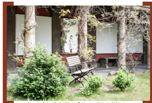
Innenhof des KinderKünsteZentrums

Weitere Informationen unter —> www.Aktion-KMS.de .